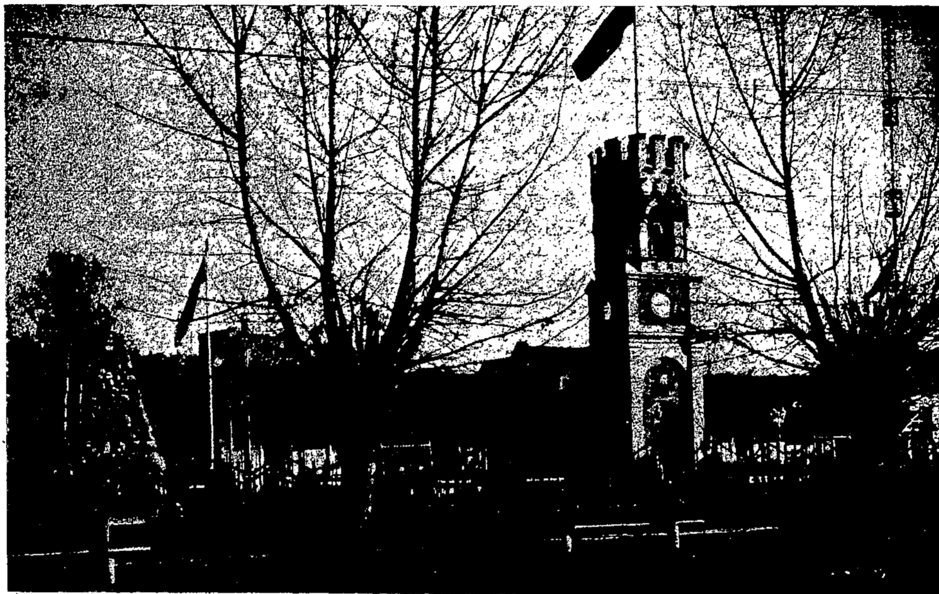
Karo muzėjus Kaune. Šale muzėjaus paminklas žuvusiems dėl Lietuvos nepriklausomybės.

klų ir municijos toli gražu nepakanka savo kariuomenei. Tų minėtų 40 pabriku gaminiai nieku gyvu negali aprūpinti 300.000 kariuomenę, nes dauguma jų teturi paprastų dirbtuvių pobūdį. Tikrai didelių ginklų ir municijos pabriku Lenkijoje visiškai nėra. Vietintelis buvęs didesnis sprogstamosios medžiagos pabrika nesenai susprogo. Vadinasi, kilus karui Lenkijos ginklavimas turėtų priklausyti užsienio. Karininkų kadrą yra sulipdytas iš buvusių Rusijos, Austrijos ir