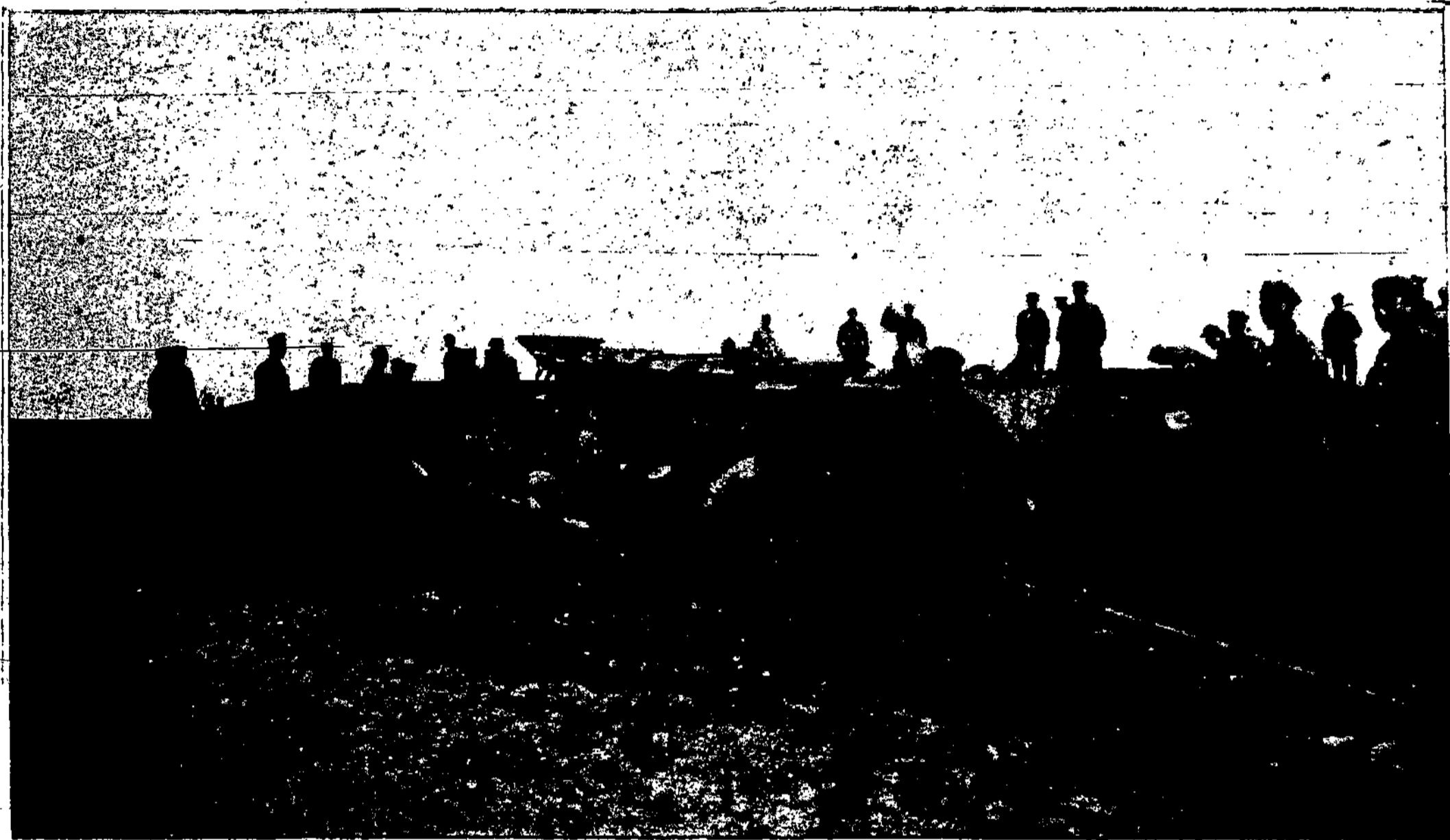
Mūsų kariuomenė prie geležinkelių tiesimo darbo.

Kas ten darosi? Kas ten drumsčia nakties tylą? Po kokių milžinų kojomis sušalęs sniegas taip liūdnei