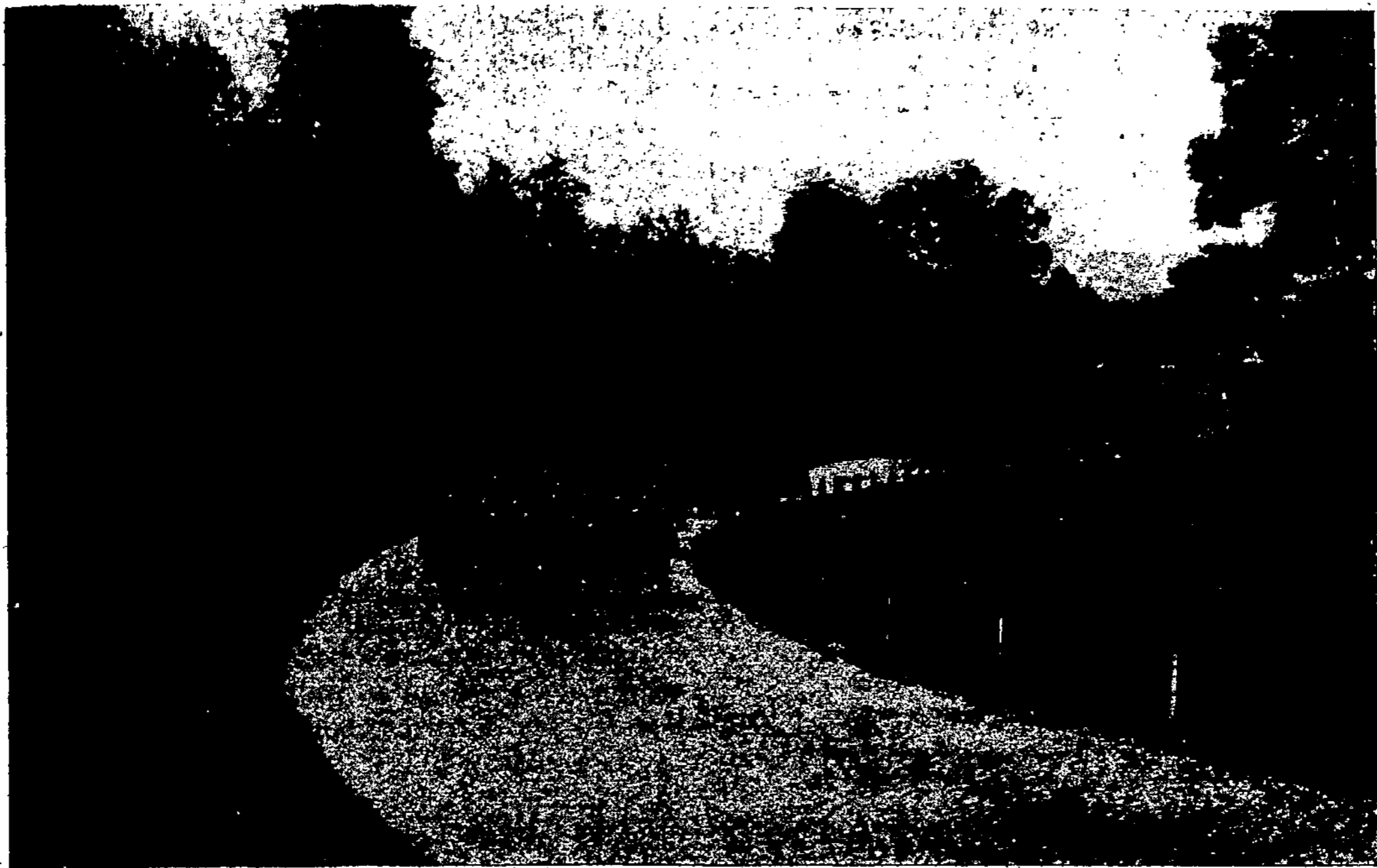
Karo mokyklos kuopa.

— Želigovskis pasitrauks. Lenkų laikraštis „Kurjer Polski“ rašo, kad Lenkijos krašto apsaugos ministerio Želigovskio atsistatydinimas esąs nulemtas. Jo vieton ministerijos valdytoju bus paskirtas gen. Osinekis.