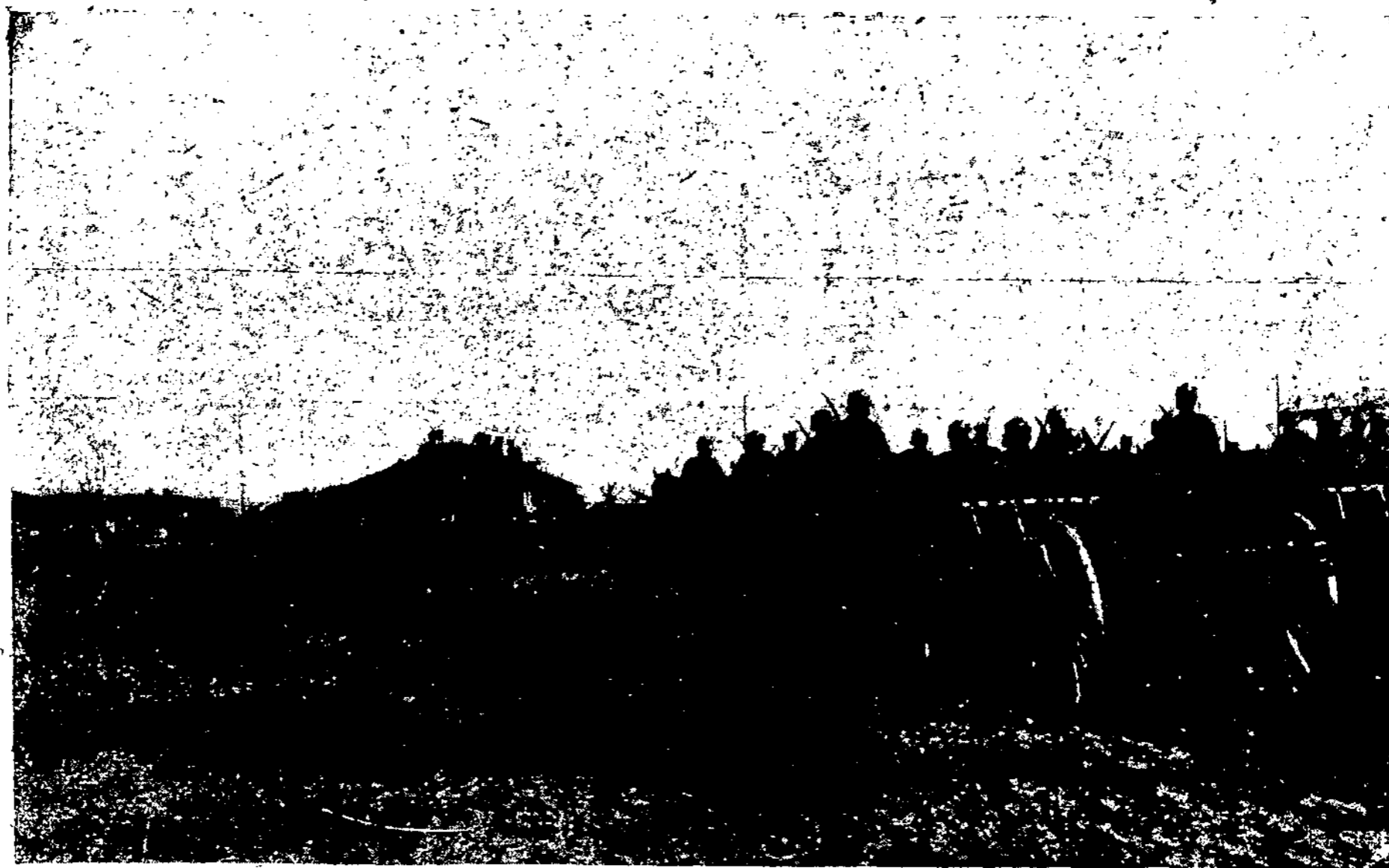
Mūsų artileristai per iškilmes.

Taigi, norint išgelbėti nuo naktinio susišlapinimo, būtinai reikia pripratinti pūslę daugiau išsitempti. Kitaip kalbant reikia stengtis šlapintis dienos metu ne daugiau 2-3 kartų. Beabejo neiš karto tai galima atsiekti. Reikalinga pripratinti iš lėto. Taip pripratinti pūslę išsitempti galima per mėnesį ar porą mėnesių laiko, vis rečiau dienos metu šlapintis.