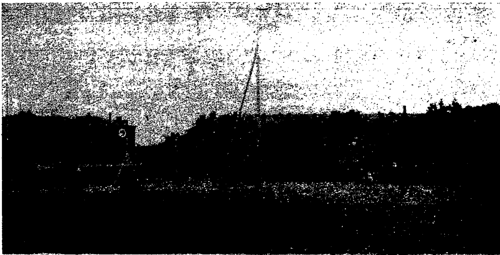
Vienas mūsų pulkų per savo metinės šventės iškilmes.

— Pradėjo siausti banditų gaujos. Pastaruoju laiku siaučia daug banditų gaujų, kurios atvirai puldinėja ne taip stipriai saugomus įvairius valdžios sandėlius, dvarus, o pastaruoju laiku pradėjo puldinėti ir traukinius. Siaurojo geležinkelio traukinį, tarp Vasiliškių ir Grivičo stočių, banditai sustabdė ir apiplėšė keleivius su grobiu pasislėpė.