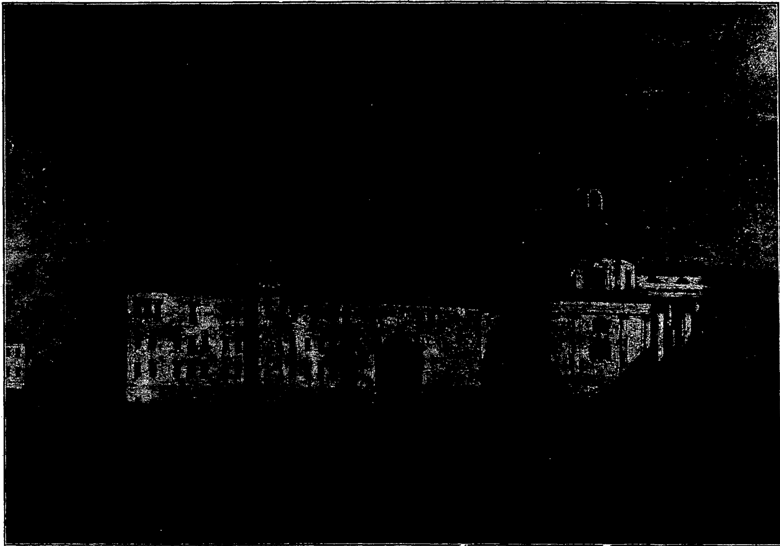
Vilnius. Žemieji rūmai, 1322. m. Gedimino pastatyti. 1505. m. juos atstatė Aleksandras Jogelaitis. 1661. m. per švedų karą sakyti rūmai liko sugriauti.

Vilniaus kraštas kolonizuojamas Lenkijos elgėtomis ir banditais, bendrai, žerė duodama tikrai lenkams