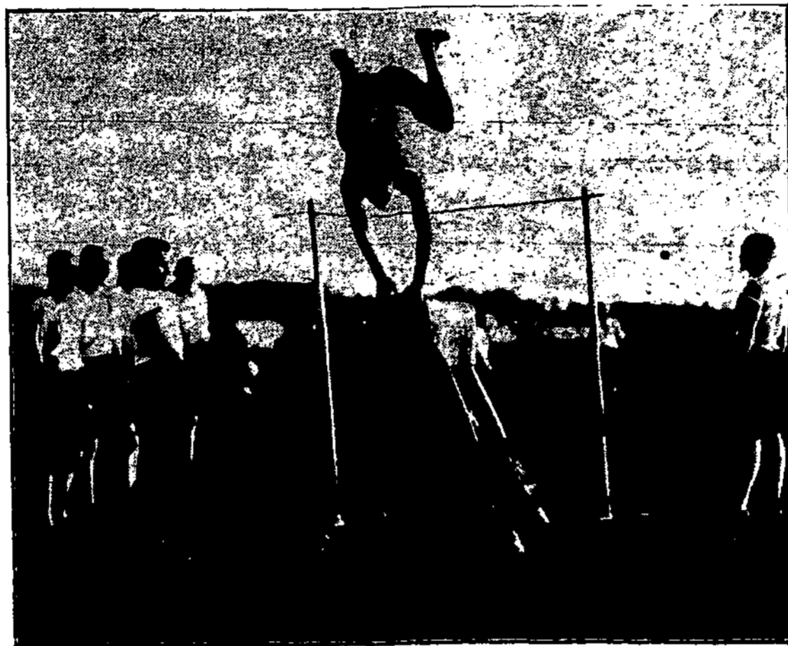
Per mokomosios baterijos sporto dieną. Šokimas per „kumelę“ (Žiūr. 364. pusl.).

Naktį rajonas ir parkas buvo gražiai nušviestas. Šventė baigėsi kareivių klube šokiais ir žaidimais. Be to, mokomosios baterijos aspirantų komandos choras svečius palinksmo dar ir gražiomis dainomis.