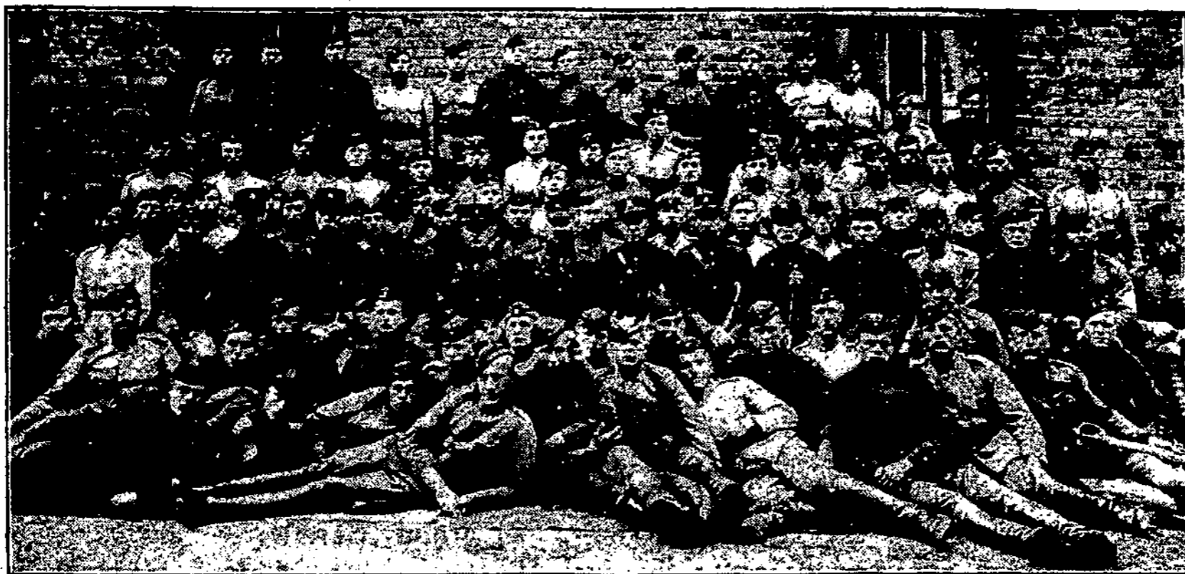
Kareiviai artileristai, baigę mokomosios komandos kursą. (Žiūr. 364. pusl.).

lietuvių ir žemaičių“, rankrašty paliko dviejų tomų „Lietuvos istoriją“ ir bendrai daug rašė, nedovanai jį ir vadino „darbo pele“. Visus savo veikalus Daukan-