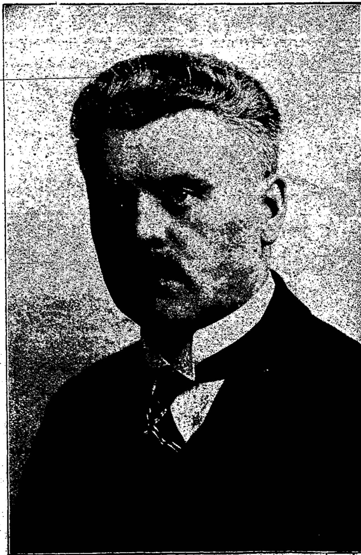
Krašto Apsaugos Ministeris pulk. lt. Antanas Merkys.

Tik per didelį ir sunkų darbą šiandien yra tai pasis ir turinga Amerika, taip gražiai suitvarkiusi ir kultu inga Vokietija, mūsų kaimynė. Dirbas, o ne tušti žodžiai žmogaus gyvenime yra viskas. Teisingai yra pasakęs mūsų naujas ministris pirmininkas profesorius Voldemaras, kad jo deklaracija (pranešima), ir kaip mano dirbti jo kabinetas, bus trumpa: „darbas, darbas ir darbas“. Žinoma, jei visi išsijuose dirbsime ir mūsų Lietuvoj bus viiems gerai ir