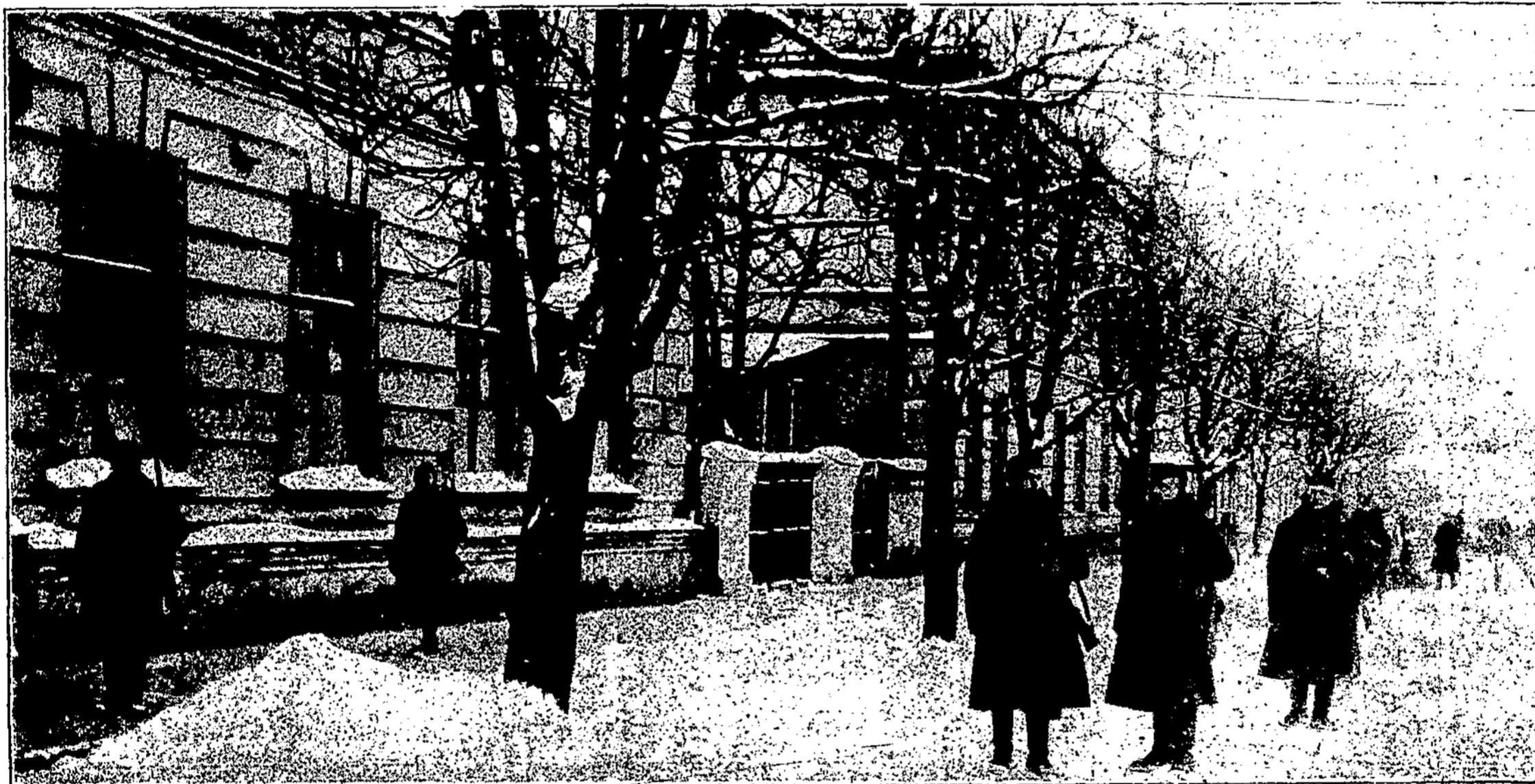
Gruodžio 17. d. Kaune: patuliai gatvėse.

Koks puikus vaizdas! Aolinui matytis Šventoji Žemaitija. Tiesa Maironis sako, kad „nieks ant Alpių nemainys“. Nors man pačiam teko gėrėtis ir Alpiais, bet tokio malonaus jausmo neiaučiau, kaip ant Šatrijos. Saulė jau leidosi ir seni sustingę trys kryžiai driekė savo šešėlius. Tolumoje miškai skendo rūkuose ir visą kraštą pradėjo gaubti tamsūs šešėliai.