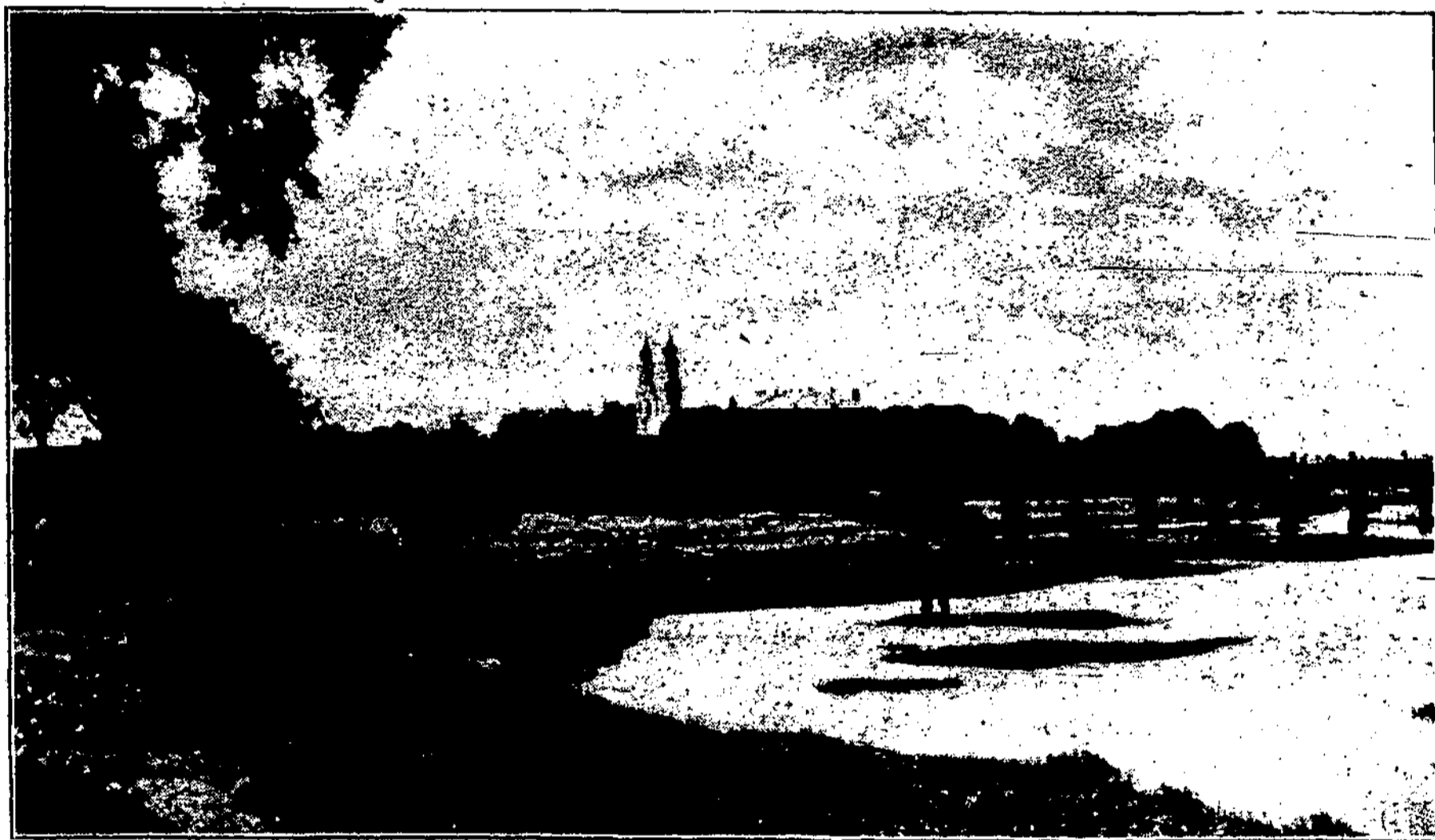
M a r i a m p o l ė.