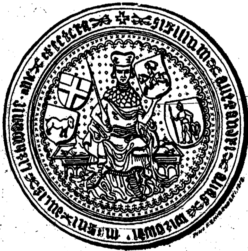
Didžiojo Lietuvos Kunigaikščio Vytauto antspauda.

Ir šiandien, vasario 16. dieną, švėsdami mūsų nepriklausomybės šventę, kas lietuvis, kam brangi mūsų tėvynė ir jos nepriklausomybė, turi tvirtai pasižadėti per šiuos naujus, jau dešimtus, nepriklausomybės metus daug dirbti savo ir kitų dvasios pakėlimui ir jos sutvirtinimui.