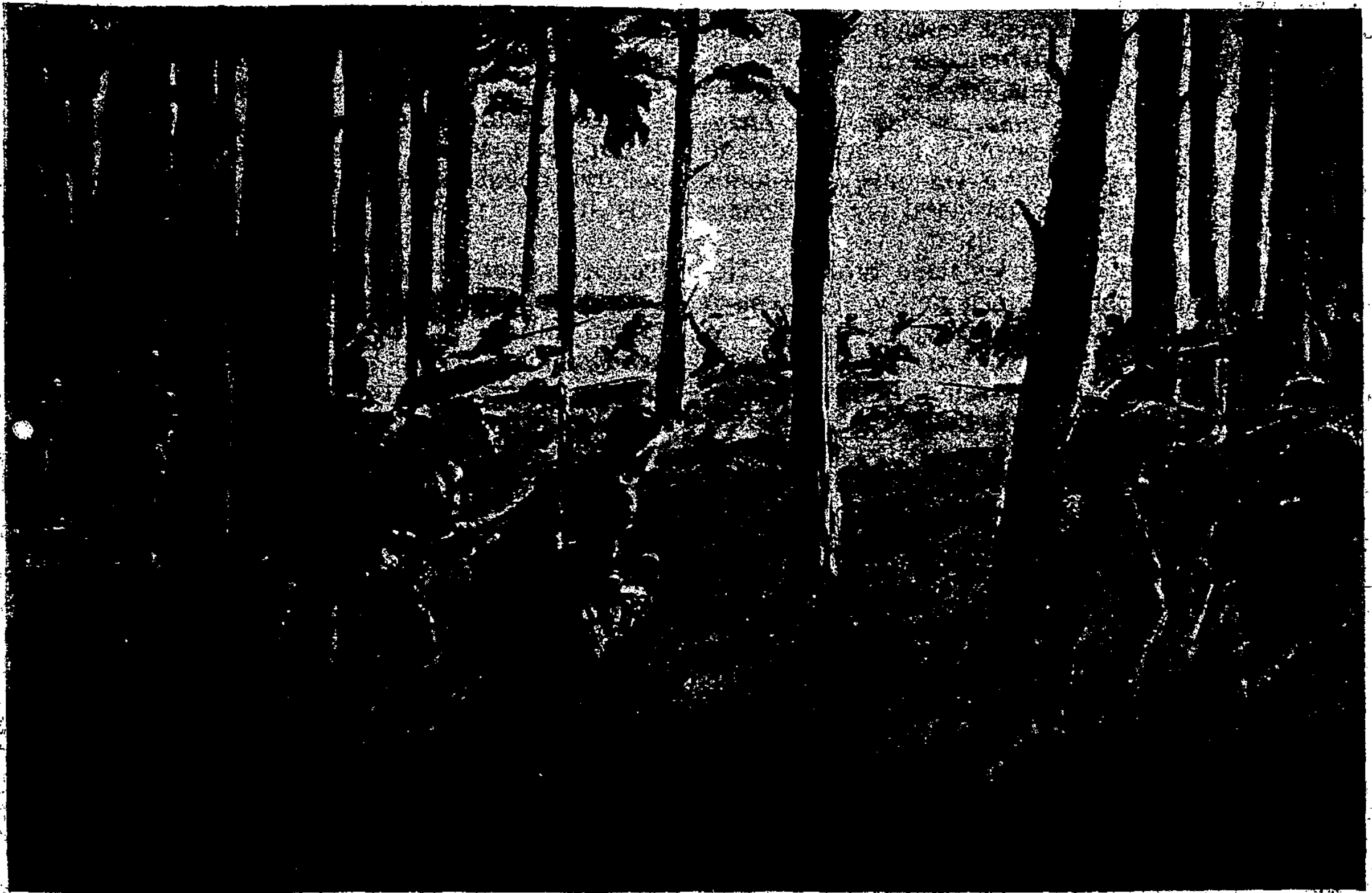
Lietuviai kaunasi su bolševikais Anykščių šilely.