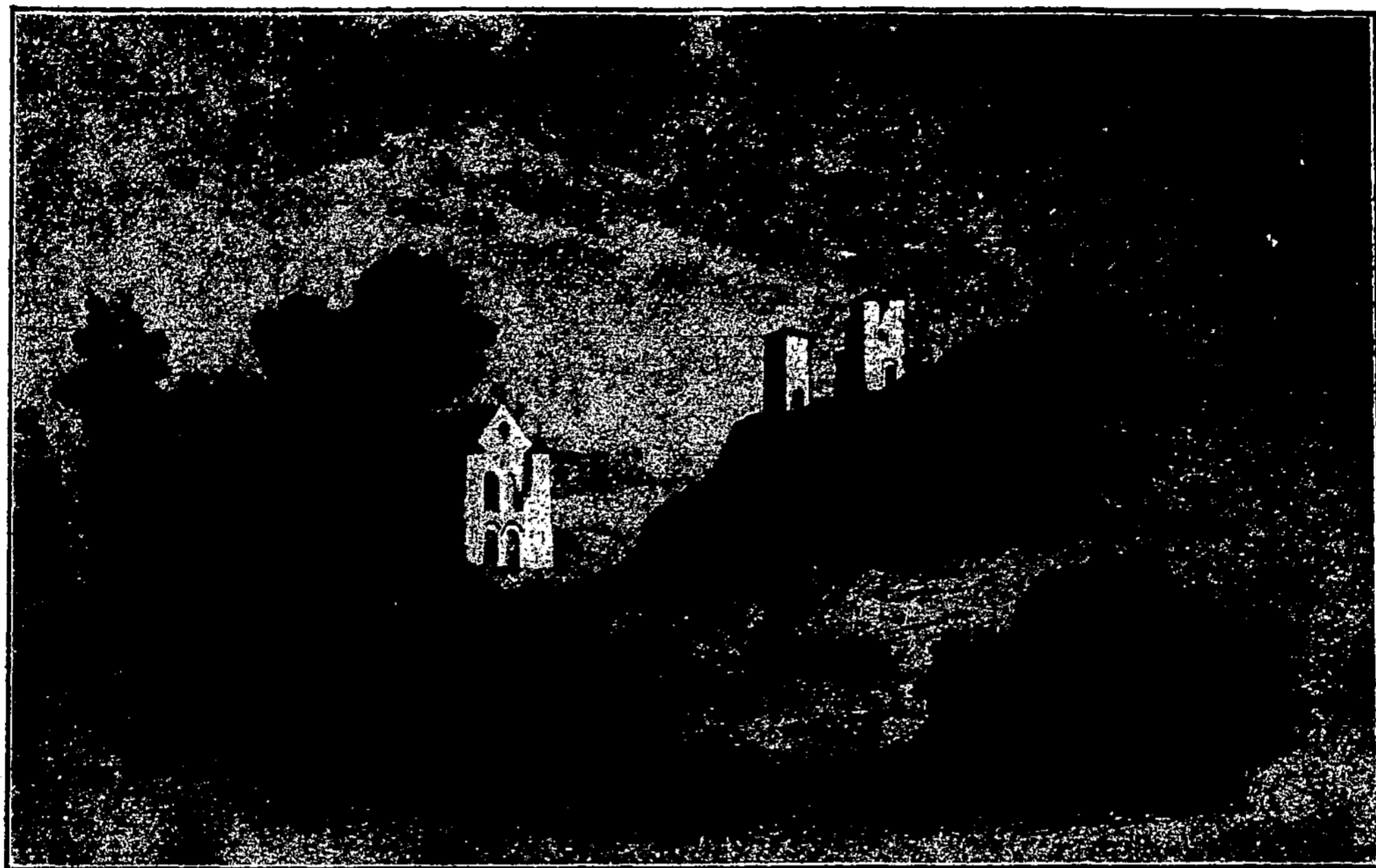
Galingosios Lietuvos senovės likučiai. Lietuvos Karaliaus Mindaugo pilies griuvėsiai Naugarduke (Minsko gub.).