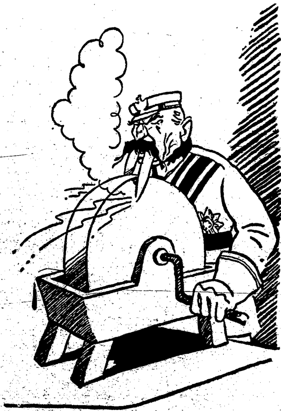
O Pilsudskis vis dar galanda dantis!

„aisčiai“. Kad pažvelgtumėm dar toliau ir vėl reikia grįžti prie kalbos. Lygiai taip pat, kaip dabar susi-daro šnektos ir tarmės, taip gilioj senovėje iš daug senesnios kalbos susidarė pirmiau „aisčių“ šnektas, vė-liau tapusi tarme ir kalba, kuri dar vėliau pati irgi skilo šnektomis ir tarmėmis. Greta „aisčių“ kalbos iš vienos bendros prokalbės atsirado ir kuomet ne visų Eu-ropos gyventojų kalbos. Tos Europos tautų kalbų gi-miningumas jau yra labai tolimas ir sutikę lietuvius su rusu bei vokiečiu, nors ir nesupranta vienas kito kalbos, bet dar turi daug bendrų žodžių. Šių pir-mykščių Europos tautų, t. v. indoeuropiečių prokalbės skilimas naujomis kalbomis, įvyko labai seniai, kaip spėja mokslininkai apie 3000 metų Kristui negimus. Kas norėtų pažinti ir toliau mūsų tautos praeitį, paklaus, o iš kur ir kuomet atsirado indoeuropiečių