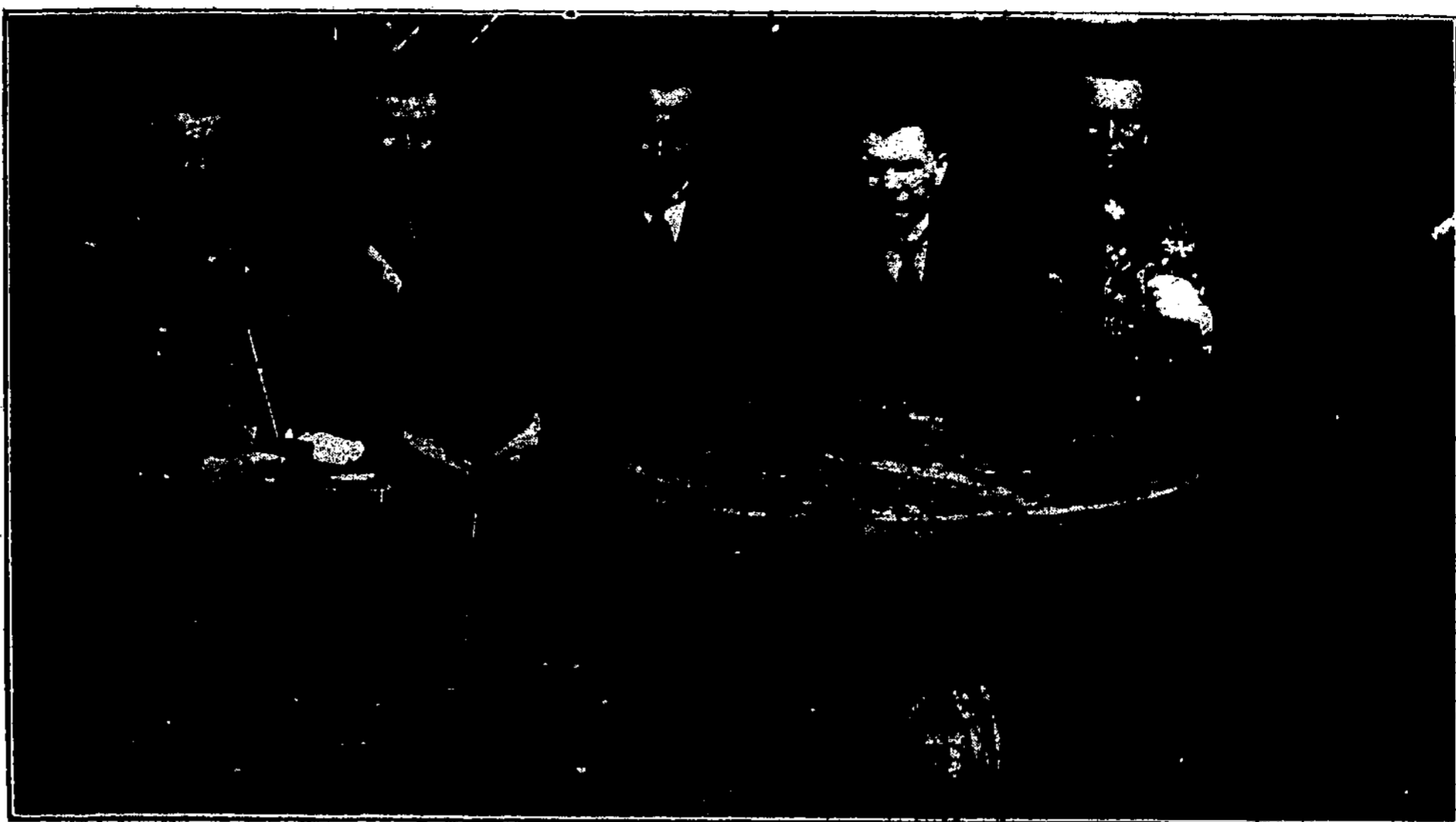
Kariuomenės Vado jubiliejų minint.

Lietuvai laisvę ir Nepriklausomybę iškovoję ginkluotieji Jos sūnūs — kariuomenė, tai kariuomenė tik ir gali tuos laimėjimus apginti, apsaugoti. Gi likusioji krašto gyventojų dalis tik visokeriopai tam kilniam kariuomenės darbui padeda. Todėl kariuomenėje privalo sąžiningai, dorai ir stropiai patarnauti vis