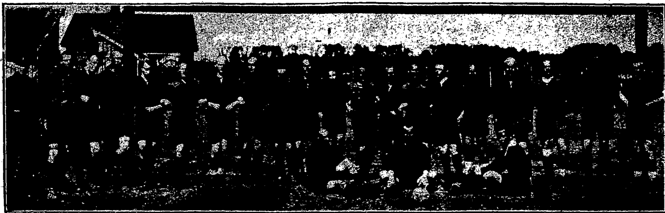
Karo Mokyklos ir 4 art. pulko futbolo komandos.

Lietuvių tarpe ypatingai maža yra arba visai nėra karo, kaip tokių, mėgėjų. Iš tikrųjų, karo, kaip tokių, ir visų jo padarinių (vaisių) visi mes nekenčiame ir stengiamės išvengti. Kuriam iš mūsų nemielas būtų ramus, gražus ir geras gyvenimas mūsų mylimam krašte?