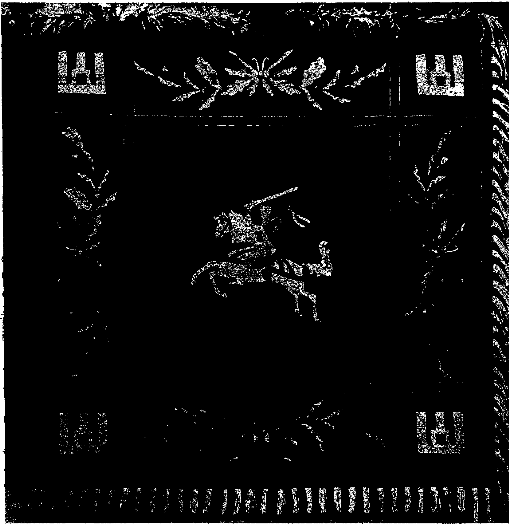
I gusarų D. L. E. K. J. Radvilos pulko vėliava. Viena pusė.