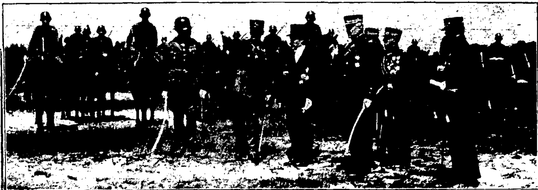
7 pėst. Ž. K. Butegeidžio pulko šventės iškilmės Klaipėdoj (1928.VIII.5.)

Viršuj: Respublikos Prezidentas A. Smetona, krašto apsaugos ministeris gen. ltn. Daukantas ir kiti mūsų vyriausybės nariai pulko iškilmėse.