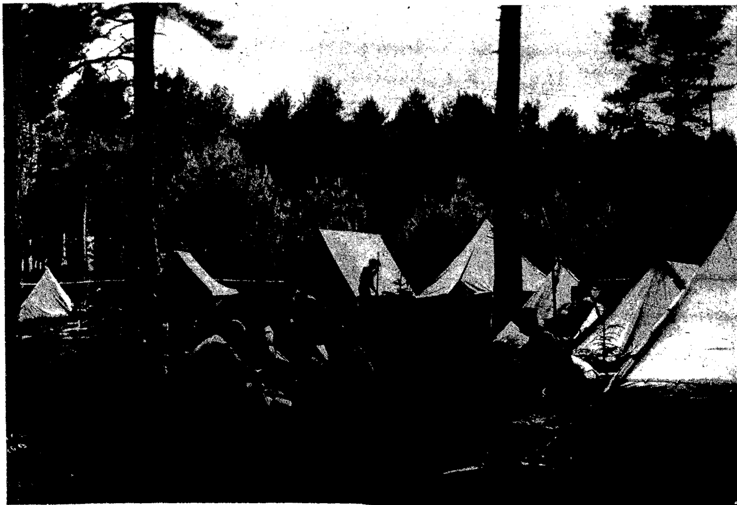
Skautų stovykla. Gražus pačioje gamtos aplinkoje gyvenimas ir svarbi savojo krašto pažinimo priemonė

Artėja pavasaris ir už kelių mėnesių pasibaigs mokslas. Prsidės atostogos. Daugelis moksleivių atostogas labai nevykusiai praleidžia ir joms pasibaigus nesijaučia pailsėję. Kad atostogų laiką galima sunaudoti naudingomis kelionėmis į žymesnes Lietuvos vietas, iki šiol daug kas net nežinojo.