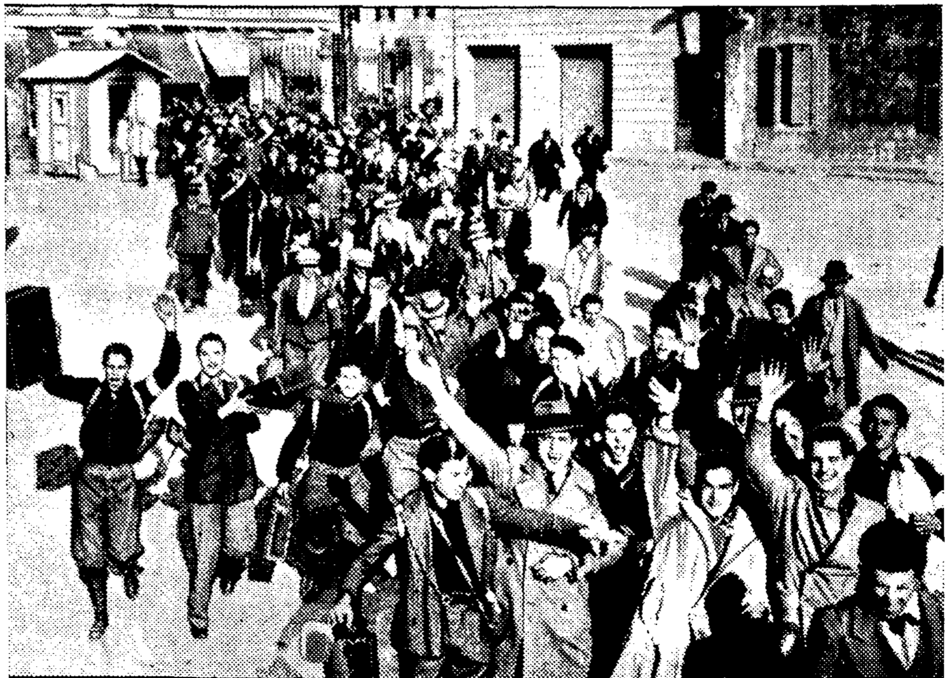
Italų naujokai linksmi stoja į savo kariuomenės eiles