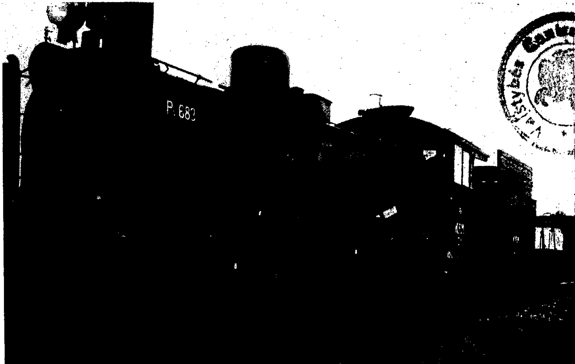
Patys mokomės — patys ir važiuojam. Iš geležinkelių kuopos darbo ir gyvenimo.