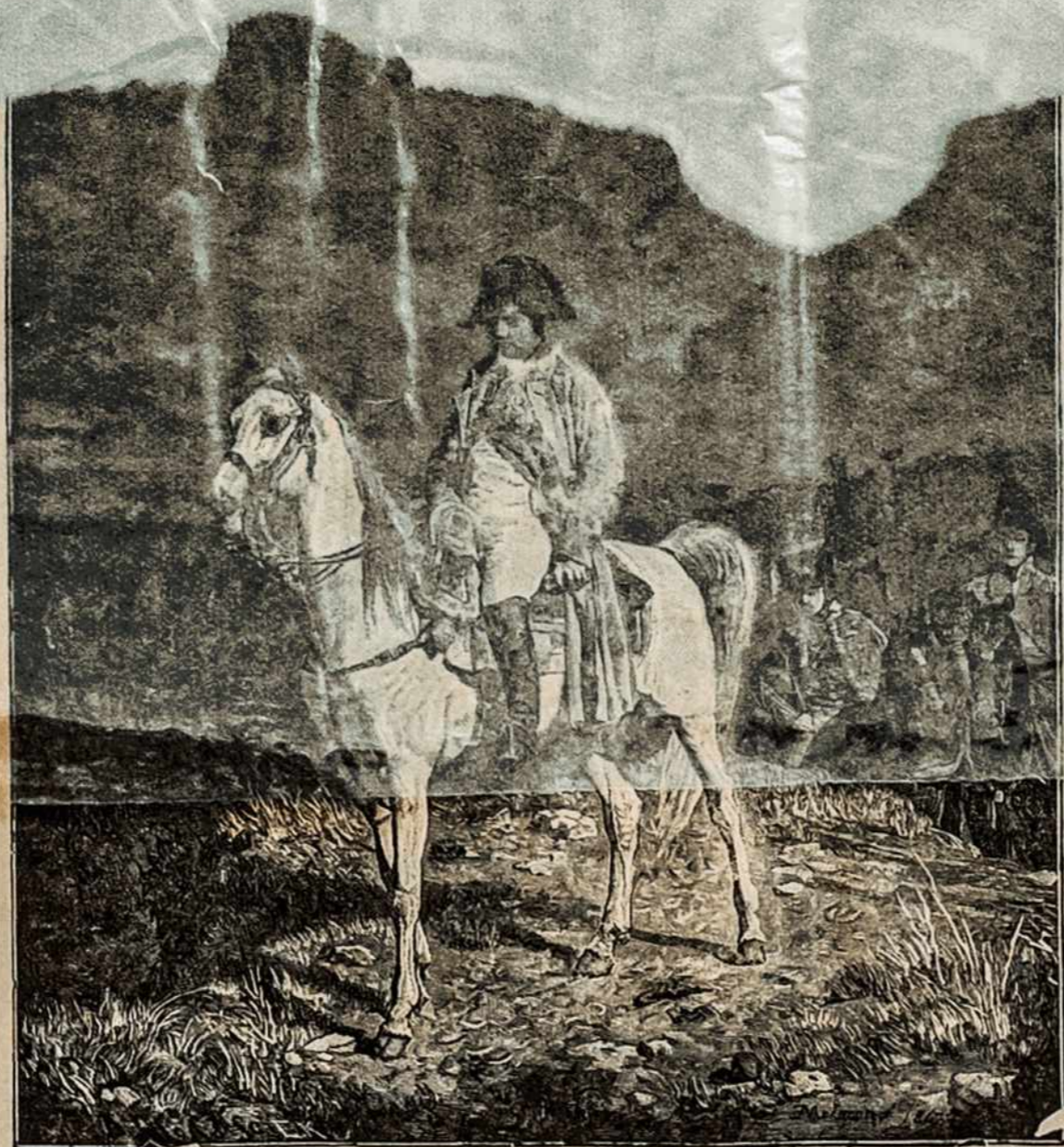
Napoleonas I. Prancuzų cecorius -- garsus karžygis, kuriam savo laike bemažo-ko nevisa pasaulė priklausė, vienok pasikelė į didelę puikybę mirė kaipo kalėjas ant szv. Elenos salos. (Platesnį apie jį apraszymą paduosime atenanziame numerije).