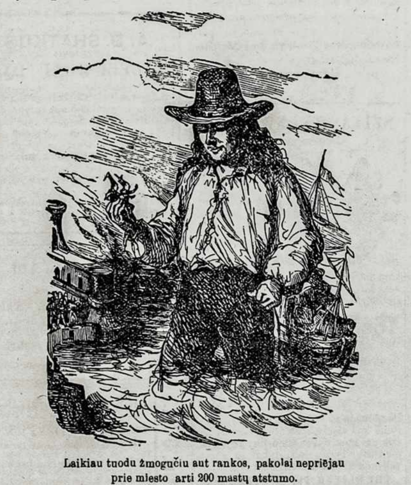
Laikiau tuoda žmogūn ant rankos, pakolai nepriejau prie miesto arti 200 mastų atstumu.