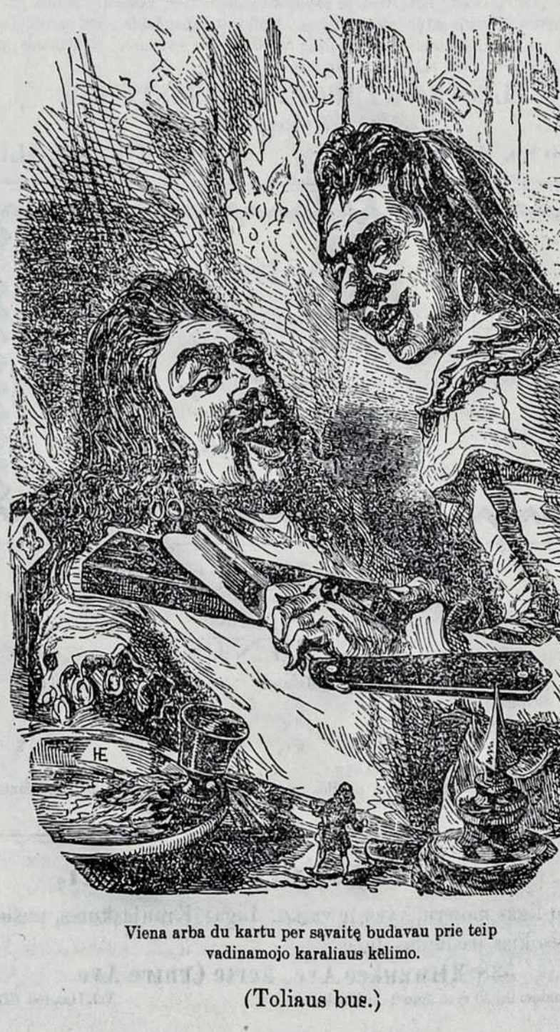
Viena arba du kartus per savaitę budavau prie teip vadinamojo karaliaus kelimo. (Toliaus bus.)

V. Skaitydami prie karaliaus rumo, aš vieną arba du kar- tu per savaitę budavau prie teip vadinamojo karaliaus kelimo ir tankiai matydavau, kaip barzdaskutys darydavo su juomi savo operacijas. Toji regyklą išpražį pagimdydavo manyje labai didele baimę, nes barzdaskučio skustukas buvo du sykiu didesnis už mūsų paprastą dalgį.