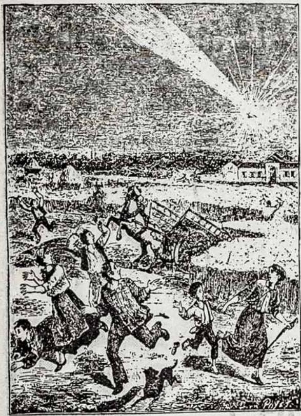
Pav. 45. Ugnies kamuolio nukritimas dienos laike laukuose.

Kalbėjome apie bolidus. Galime taipgi priminti ir aerolitus arba uranolitus, ty