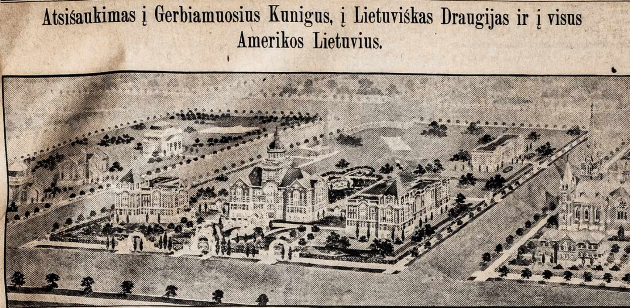
Plenas Naujos Sv. Stanislovo Kolegijos, Chicago, Ill.

Sv. Stanislovo Kolegija įsteigta ir atidaryta 1892 metuo- se su tiesažinyne Illinois valstybės. Kolegija yra užlaikoma lenkų vienuolių, "Tėvų iš Numirusių Priskelimo." Lietuvių jaunuomenė nuo pat pradžių atidarymo lanko Sv. Stanislovo Kolegiją. Nors nedidelis jų būrelis Kolegiją lanko, bet vienok kas metai jų būna po devynis arba ir dau- giaus. Čionai lietuviai turi savo knygyną ir draugijų vardu, "Maironio Literatishkoji Draugija." Lietuvių mokiniai lavi- nasi tarp savęs lietuvių kalboje ir literaturoje du kartu per savaitę. Jaigu ateinančiais metais lietuvių rasis skaitlinges- nis būrelis, tai bus įvesta mokslo programan lietuvių kalba. Šiame laike Sv. Stanislovo Kolegija randasi palei Divi- sion gatvę, kur norints bustas ir gana ruimingas, bet kasmetai darosi vis ankštesnis, suplaukiant iš visų kraštų daugiau mo- kinių. Taigi "Tėvai iš Numirusių Priskelimo" neseniai nuta- rė pastatyti naują ir daug ruimesnę Sv. Stanislovo Kole- giją. Tam gražiam užnamui visoje Amerikoje tarp lenkų ir lietuvių renkamos aukos. Naujoji Kolegijoj apart gimna- zijos kurso bus aukštesnis universiteto skyrius, bus aukštesni mokslai. Taigi atsiliepiame į Jus Gerbiamieji Lietuviai Kunigai, Lietuvių Draugijos ir abelnai į visus Amerikos Lietuvos, pa-