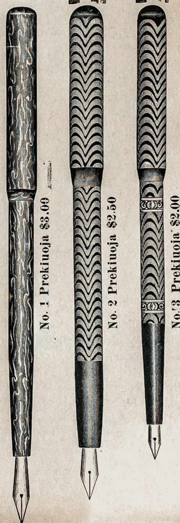
No. 1 Prekuoja $3.00

Mēs užpirkome daugybę Fountain Plunksnų, kurias dabar pardavinėsime už labai pigę prekę. Fountain Plunksna yra paranki kiekvienam žmogui turėti, nes kotelyje isipila ataramentas ir galima naudoti visur ir visada, parasiūs sumovei taip, kad plunksna nesigadytų ir nešiojies kišeniuje. Pati plunksna auksinė su storu kotuku.