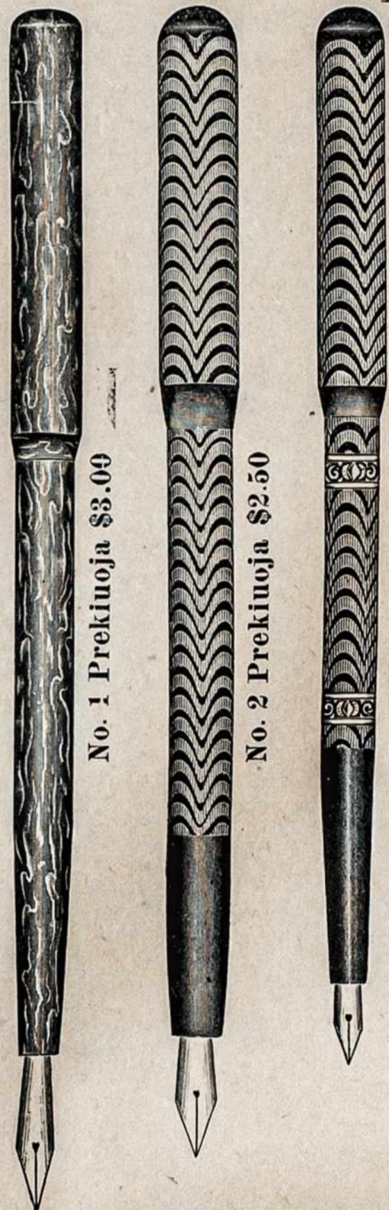
No. 1 Prektuoja $3.00

Mes užpirkome daugybę Fountain Plunksnu, kurias dabar pardavinėsime už labai pigę prekę. Fountain Plunksna yra paranki kiekvienam žmogui turėti, nes kotelyje įsipila atramentas ir galima naudoti visur ir visada, parasius sumovei taip, kad plunksna nesigadytų ir nešiojies kišeniuje. Pati plunksna aukšinė su storu kotuku.