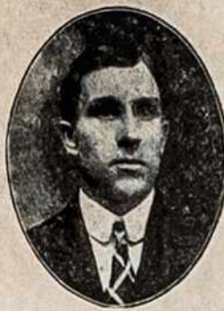
P. STEFANAITS Lietuvos parduotas No 117 patarnaus jums visam store.

Vyriški ir moteriški visoki drabužiai yra padirbti iš geriausios materijos pagal naujausią madą ir parduoda pigiau negu kur kitur.