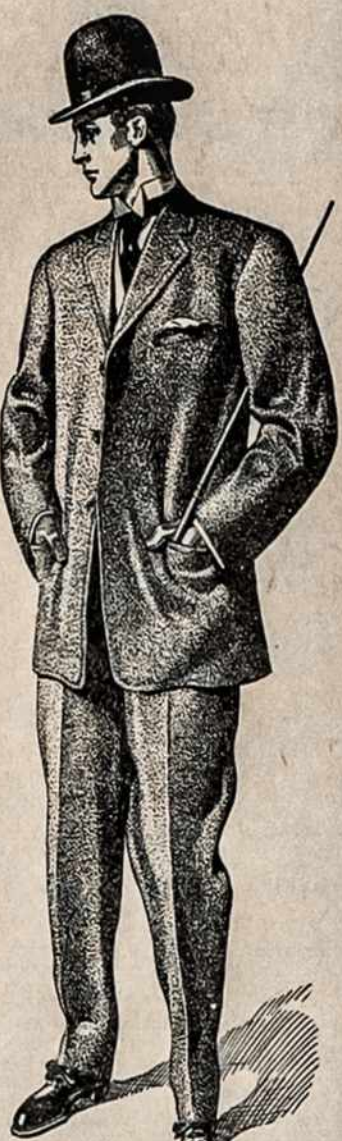
copyright 1908 by Hart Schaffner & Marx

PASARGA: "Už korespondencijas ir aparatinimus "Kataliko" Redakcija neatasko.