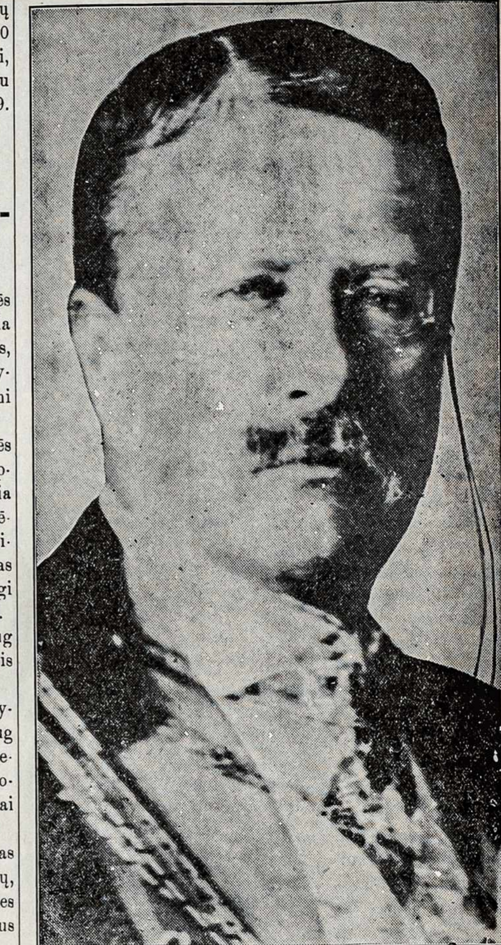
Vienas savo pavidalo sudėtinis paveikslas pulki- ninko Roosevelto ir kaizerio Vilius. Netrukus pulk. Roosevelt aplankys Berlyną. Vokiečiai krikščiauja tikadamies pamatyti garsų Amerikos pilietį.

Nemušk manęs beširdžiai botagu, jei aš ant kelio, veži- mą traukiant, persigastu ir krupteliu, kadangi tankiai aš galiu pridirbti nelaimių staiga bešokdamas.