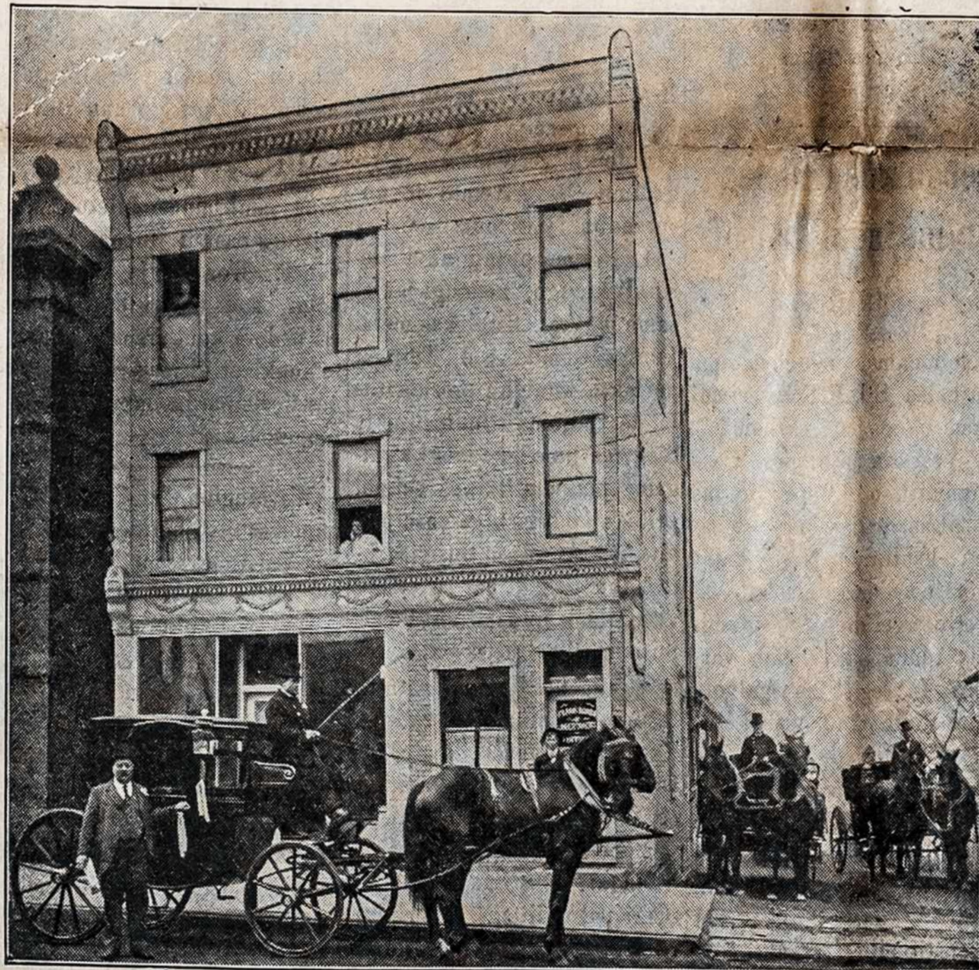
PRANO BURBOS NAUJAS HOTELIS.