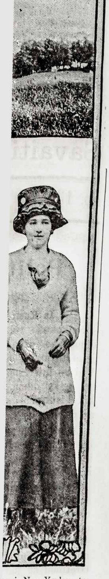
o į New Yorką, te-

Amerikos Jungtinių Valsčių ambasadoriui Berlyne kaizeris Vilius pranešęs, kad jo sūnus, sosto inpedinias, keliaudamas į Tolimuosius Rytus, aplankysias taip pat ir Filipinų salas. Amerikos karo ministeris prašęs, idant tasai kaizerio sūnus aplankytų ir Jungtinius Valsčius, bet kaizeris pasakęs — reik tas dalykas pirmiau dar apgalvoti.