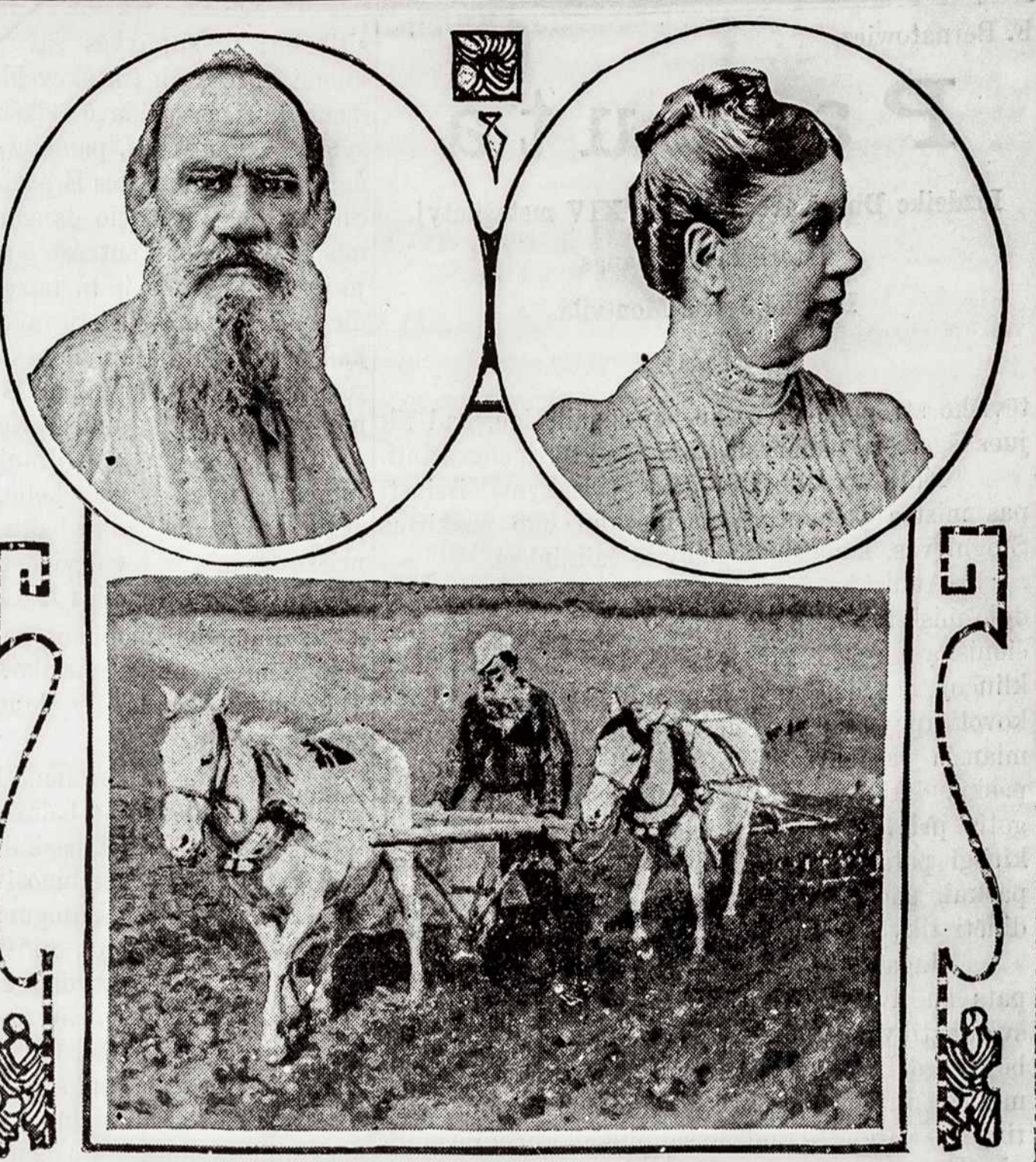
Garsus Rusijos filozofas - raštininkas Levas Tolstoj su savo žmona. Apačioj parodoma, kaip tasai se- nis mokslininkas savo dvarelyj fiziškai dirba - aria. Parėjo žinios, jog Tolstoj vėl susirgęs pavojingai.

Tai plieno "karalius", milijonierius J. P. Morgan. Paskiausia jo fotografija. Galingas žmogus, turintis saujoj tiek daug milijonų.