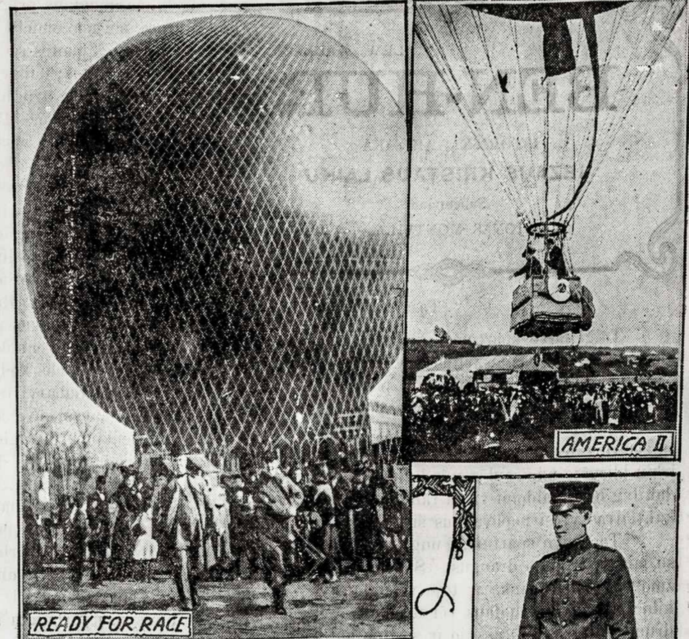
Vienas iš dešimties orlaivių, kurie neseniai pasileidę lenky nesna iš St. Louis Mo., Vienas kažin kur pražuvęs ir jo niekur negali surasti. Pasakojama, jis lėkęs į Kanadą ir, regis, tenai milžiniškuose miškuose nusileidęs. Kanados valdžia kiek galėdama rūpinasi to orlaivio suieškoti. Kiti visi laimingai nusileidę, tik vienas ežeran inpuolės. Tai būta tarptautiškojo kontesto.

Prezidentas Taft galutinai nusprendė ištraukti ant paviršiaus vandens kar laivą "Maine", kuris nugrimzdes Havanos uoste.