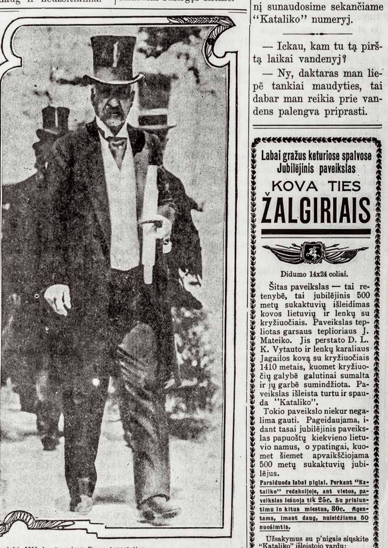
Tai plieno "karalius", milijonierius J. P. Morgan. Paskiausia jo fotografija. Galingas žmogus, turintis saujoj tiek daug milijonų.

Tai plieno "karalius", milijonierius J. P. Morgan. Paskiausia jo fotografija. Galingas žmogus, turintis saujoj tiek daug milijonų.