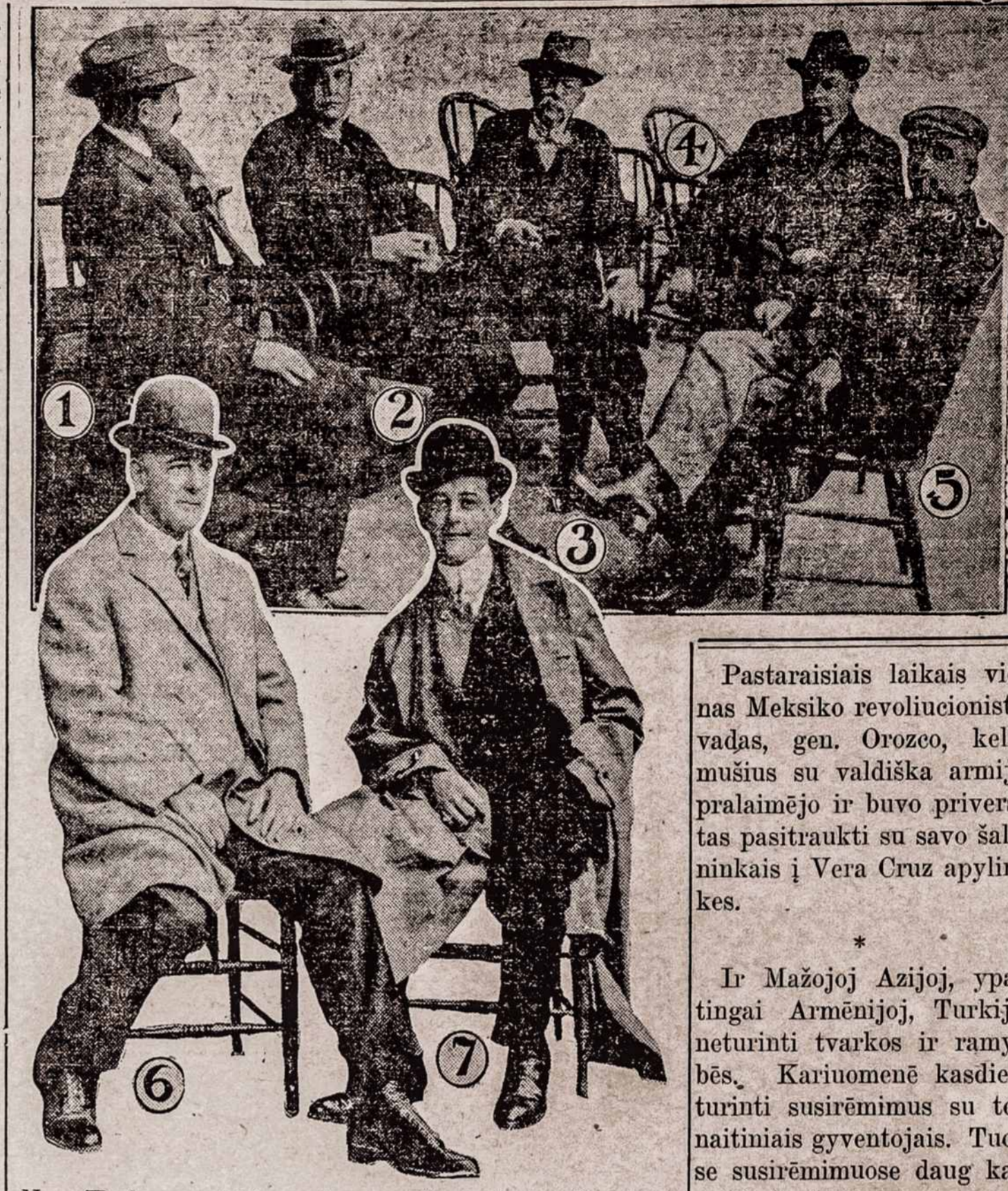
New Yorko republikonų konvencija mieste Saratoga, N. Y.

Wilsono apginėjas sako, kad "Wilsonas priešinosi tiems, kurie stengėsi neda- leisti Rymo katalikams įgy- ti kokias valdiškas vietas". Beabejonės, žmonės kurie bandė nedaleisti katalikus į tokias vietas, turėjo žuoti, kad Wilsonas yra katalikų priešu, kitaip jie tai nebu- tų dare. Niekas neišdrįstų įžeisti prezidentą Taftą rei- kalaudamas jo, kad jis ne- duotų valdiškos vietų katali- kų tikėjimo žmojęms. Vi- si neklusūs žino, kad pre- zidentas Taftas visai nepai- so kokio tikėjimo žmogus, kurį jis nuskiria į kokią vie- tą, by tik jis yra tokiai vie- tai atsakantis. Kuomet pre- zidentas Taftas nuskyrė Ed- vardą D. White, iš Loui- sianos, Rymo Kataliką, į augščiausio Sūvienytų Val- stijų teisėjo vietą, vieną iš