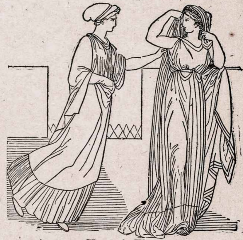
Venus ir Elena.

Visi kunigaikščiai sutiko manydami, kad tai esąs geriausias karaliaus sumanymas. Paskui Tyndarus išreiškė jiems savo pripažinimą, idant jie visados pasiliktu kunigaikščiutes draugais, ta- da Elena galėtu sau tinkamiausią pasiskirti, be to, kad jie visi patį karalių užstojo pasitaikius visokių priešininkų ginkluotiems užpuolimams.