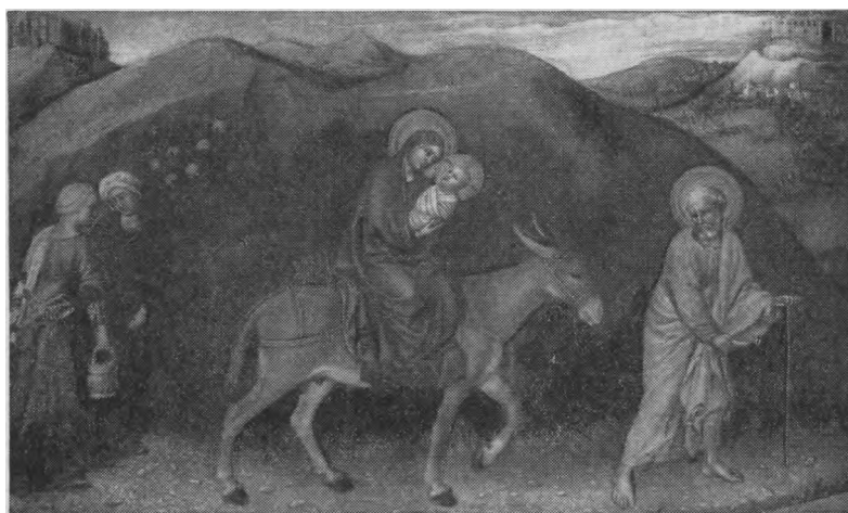
Gentile da Fabriano