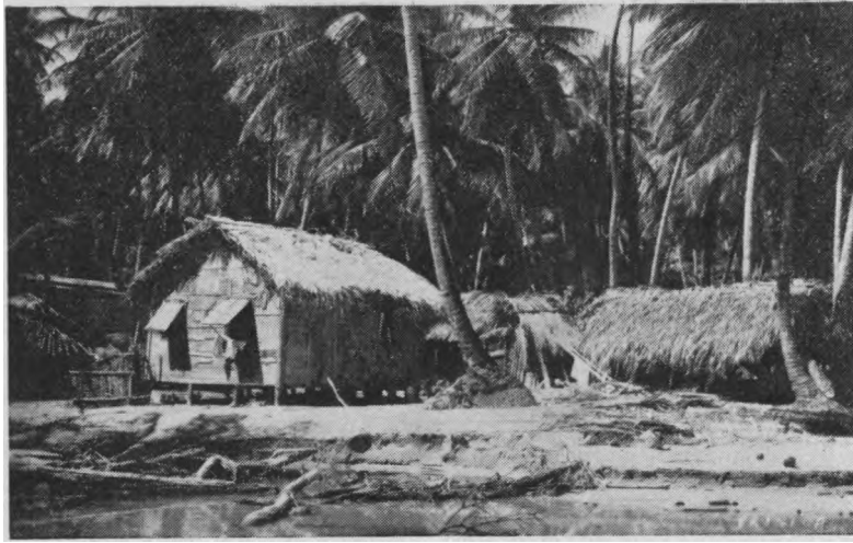
Trinidad salos gyventojų lūšnelės

tų jaunuolių susijungusi “amžina moteryste”. Jų gyvenimas yra gana asketiškas: jiems negalima gerti nei alkoholio, nei kavos, nei arbatos. Taip pat negalima rūkyti. Jie vaikščioja nuo durų prie durų, kalbindami žmones prisidėti prie jų tikėjimo.