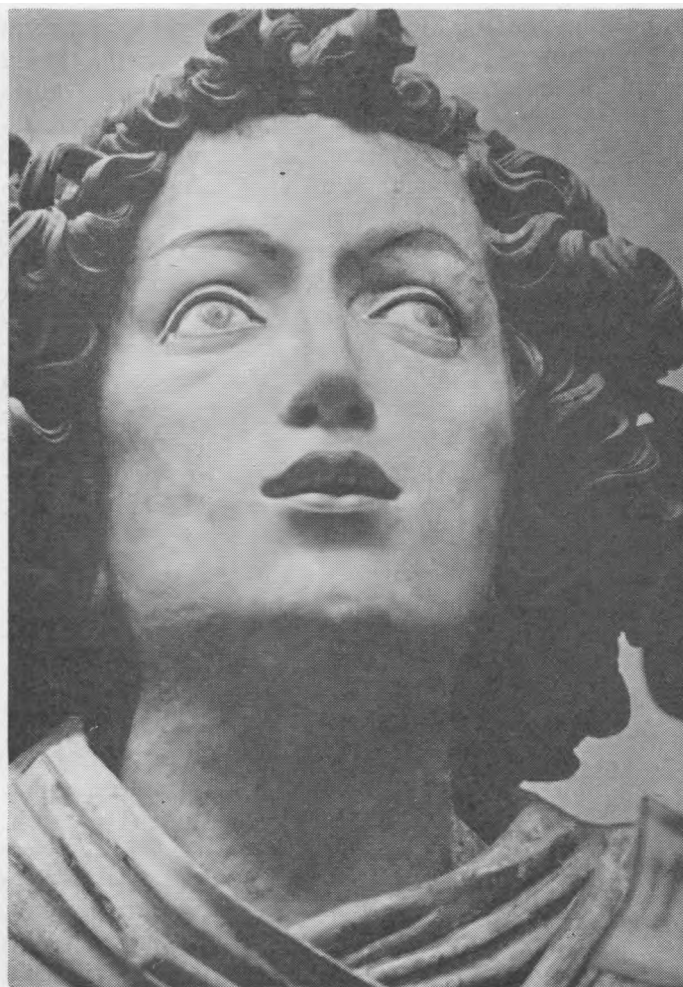
Veit Stoss (1445-1533)