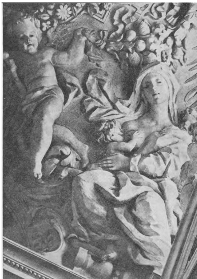
Šv. Petro ir Povilo bažnyčios vidaus papuošimai

Svarstant tuos klausimus, reikia dar nepamiršti ir to, kad neretai, kad ir truputį dėl saikingo pavydo kentėdama, ypač moteris yra laiminga, nes toks pavydas vis dėlto apčiuopiamiausiai įrodo meilę. Daugelis liūdėtų, jei kitoje pusėje nepastebėtų jokių tokio pavydo ženklų. Be to, sukelti pavydą nekarta yra geriausia priemonė įkaintinti vėstančią meilę ir prie savęs kitą pusę labiau pririšti. Dažnai juk žmogus pradeda kitą pusę labiau branginti, kai pajunta, kad kas nors kitas ją brangina ir ja domisi. Tada pradeda labiau vertinti tai, ko yra pavojus nustoti. Todėl iš šito taško į sveiką pavydą žiūrėdamas, vienas rašytojas taip rašė: "Sakoma, kad pavydas yra mylimo asmens užgavimas... Švelni