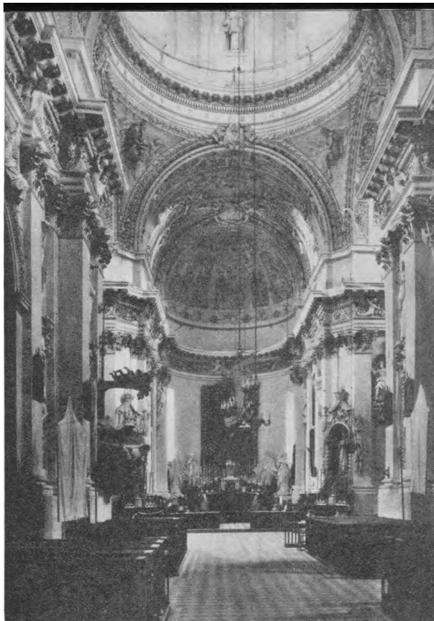
Šv. Petro ir Povilo bažnyčios vidus

Bažnyčios viduje yra apie 2000 įvairių šventųjų gyvenimo momentus vaizduojančių skulptūros marmurinių grupių. Šiuos papuošimus atliko iš Romos pakviesti menininkai, kurie čia darbavosi apie trisdešimt metų. Po bažnyčia yra palaidota daug žymių Lietuvos žmonių, ju tarpe ir pats Pocius, ant kurio kapo, pagal jo norą yra užrašas: „Hic iacet peccator“ (čia guli nusidėjėlis).