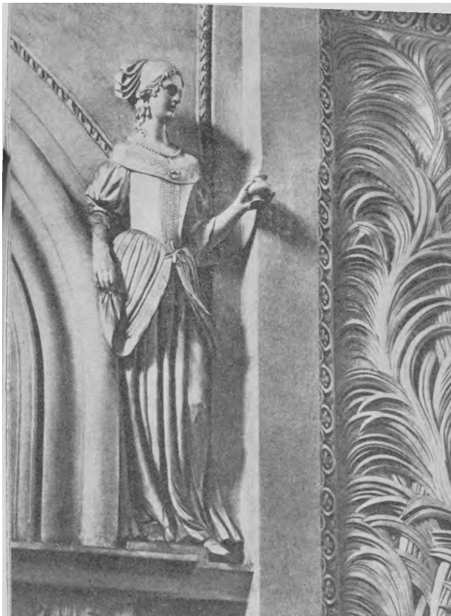
Šv. Petro ir Povilo bažnyčios vidaus papuošimai

miai pasireiškia, toks nepasitikėjimas negali skaudžiau užgauti, nes, giliau išvelgus, tai yra ne tiek nepasitikėjimas tuo asmeniu konkrečiai, kiek nepasitikėjimas apskritai žmogaus prigimties silpnumu. O liguistas pavyduliavimas skaudžiai užgauna, nes viena pusė, nuolat nepasitikėdama kita puse, prileidžia, kad tas asmuo, kuriuo nepasitikima, yra tokia menkybė, toks becharakteriškumas, kad jis gali suklypti kiekviena proga ir kiekvienu metu.