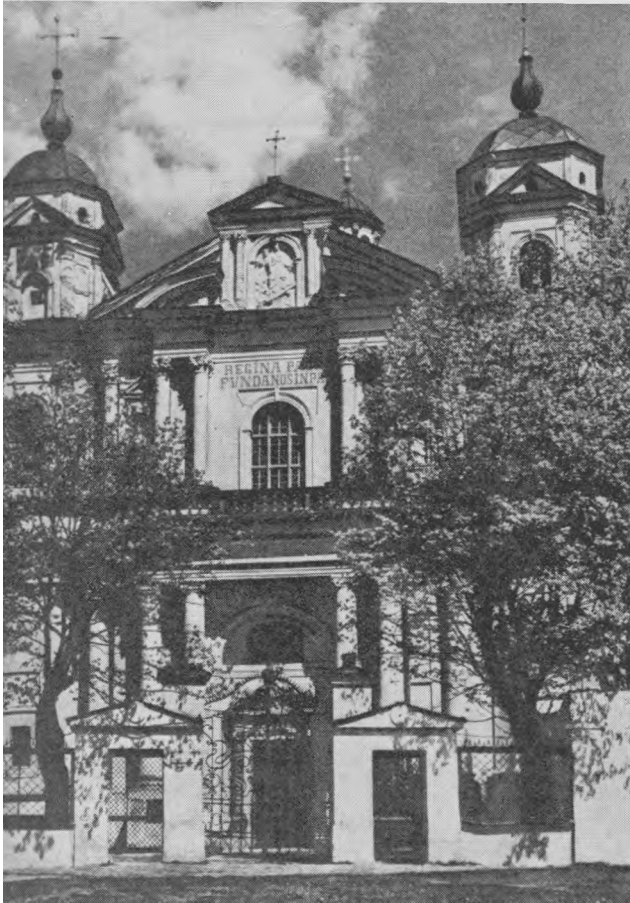
Šv. Petro ir Povilo bažnyčia Vilniuje

įdomi psichologinė aplinkybė. Atsiminkime, kad dar ir žymiai vėliau, kai jau tikrai lietuvių liaudis buvo stipriai sukatalikinta, krikščioniški papročiai ir pagoniški prietarai ilgai gyveno vieni šalia kitų. Jie egzistavo, vieni kitiems neprieštaraudami arba bent nekliudydami. Kurioje nors vietoje užrašyti pagoniški burtai ar papročiai dar jokių būdu nėra priskirtini visai Lietuvos liaudžiai. Jau ir daug vėliau, kai Lietuva skaitėsi katalikiškas kraštas, vis vienoje ar kitoje vietoje būdavo sutinkami dar neužmiršti prietarai, bet jų negalima laikyti absoliučiu rodikliu pažinti krašto religinei būklei.