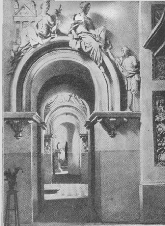
Šv. Petro ir Povilo bažnyčios vidaus papuošimai

Paaugę jie būna rūpestingi ir ypatingai švarūs. Ilgai pasilikdami vienuomoje, jie daug mąsto apie save, bet daugiausia vis iš blogosios pusės. Mėgsta liūdnas pasakas ir istorijas. Su amžiumi nesuderintas rimtumas juos iš kitų vaikų išskiria. Jie, kaip seniai, apie mirtį ir apie vargus galvoja. Kartais šie "seniai galvočiai" gali pasižymėti labai savarankišku abstrakčiu galvojimu, ypač jeigu jų nervų sistema dar nėra visiškai nusilpusi ir jeigu jie yra tinkamai auklėjami. Dažniausiai šio tipo jaunuoliai mikčioja, neaiškiai kalba, sunku iš jų žodį ištraukti.