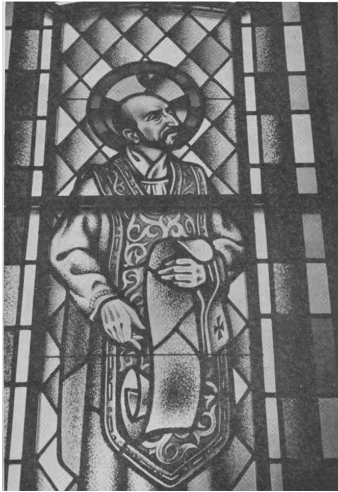
Šv. Ignacas Loyola (jėzuitų koplyčios vitražo dalis), įsteigęs Jėzuitų Ordiną 1540 m. Dabar pasaulyje yra apie 35.000 jėzui-

į pasiekimą Jo valios, t. y. taikos žemėje."