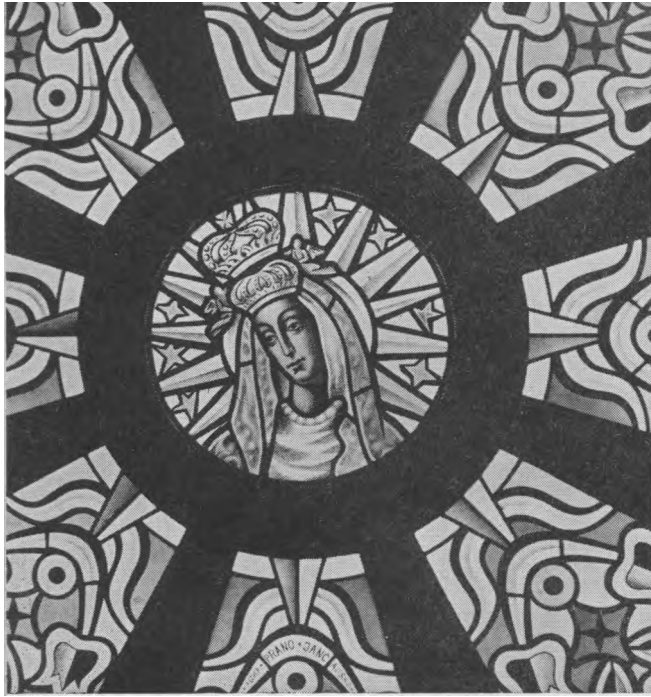
Jėzuitu koplyčios priešakinio vitražo (rozetės) dalis

Iki jėzuitų atvykimo Vilniuje nebuvo jokios katalikiškos spaustuvės. Jiems pasisekė perkelti Vilniun Radvilos Juodojo Nesvyžiuje įsteigtą spaustuvę. Čia ir prasidėjo poleminių bei teologinių raštų banga prieš protestantus. Ruošdami viešus disputus, sėkmingai atnaujindami ir išplėsdami šv. Kazimiero kultą, organizuodami liturginį pamaldų iškilmingumą, rengdami mokinių teatrus, jėzuitai sėkmingai kovojo prieš protestantus.