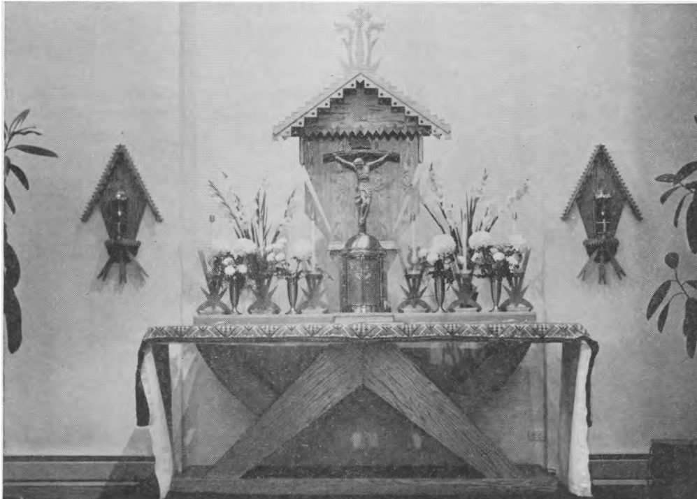
Jėzuitų kopyčios didysis altorius

Piktoji dvasia, kaip rašo net rimčiausi šventojo biografai, visokiais išoriniais būdais vargindavo Arso kleboną, ypač kai jis naktimis atsiguldavo trumpam poilsiui. Visoki nieku nepaaiškinami triukšmai aplink kleboniją ir klebonijoje, durų daužymai, neįjaukūs šauksmai ir visokių gyvulių balsai, baldų stumdymai ir kitokių įkūrūs varginimai būdavo dažni reiškieniai. Atrodo, jog piktosios dvasios visa tai buvo daroma tam, kad šis didysis kovotojas su nuodėme, tai kovai skiriamas visas savo dvasios ir kūno jėgas, tų jėgų visiškai netektų ir pagaliau nuleistų kovojančias rankas. Bet paslaptingoji ir galingoji Dievo malo-