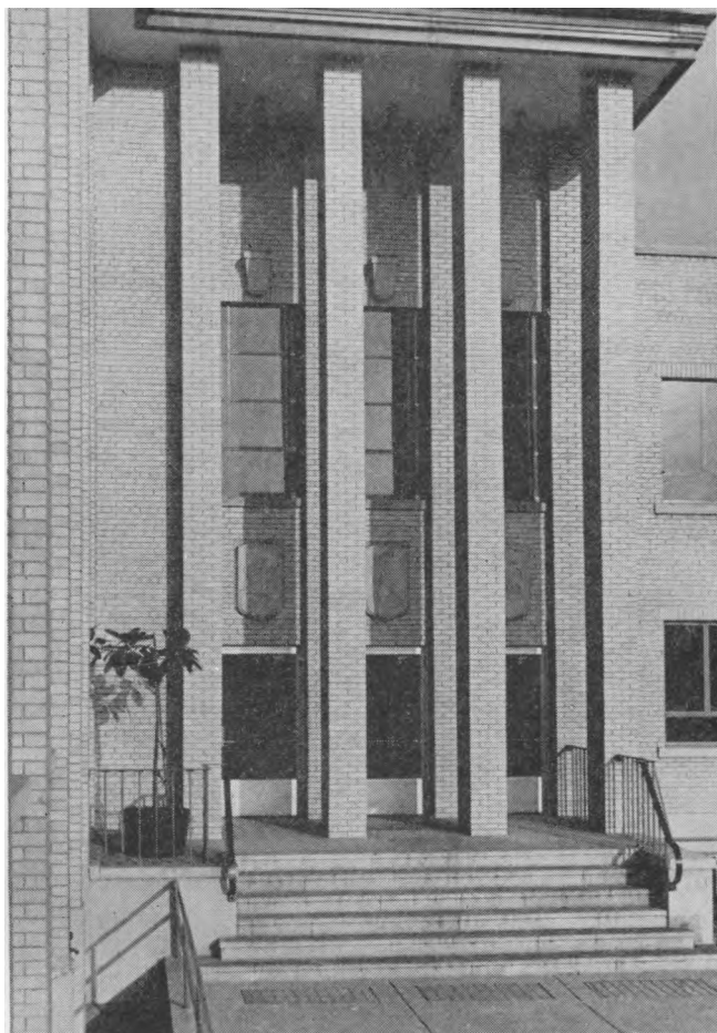
Jaunimo Centro portalas

Nagrinėdami tą medžiagą, kuri sudaro psichomotyvinių testų eilę, iširtų ir pritaikytų vaikui paskutiniųjų dvidešimties metų bėgyje, mes joje randame tiesioginiai ir netiesioginiai tuos pačius požymius, k. a.: medžiagą psichosensorinei sandarai tirti, medžiagą psichiniam veikimui įvertinti — laipsniškai mnemoninę (skatinančią atmintį), asociatyvinę, kūrybinę, intuityvinę,