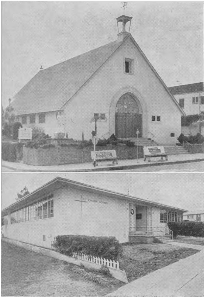
Los Angeles lietuvių Šv. Kazimiero parapijos bažnyčia ir mokykla.

na ir taurę ir sakė: "Imkite ir valgykite, imkite ir gerkite". Šv. Mišiose Kristus tampa ne tik mūsų auka, bet ir mūsų maistu. Mums paaukojus po konsekracijos kilniąją Kristaus Auką, Dievas, tarytum nenorėdamas nusileisti šiose dosnumo lenktynėse, šv. Mišių komunijoje vėl atsako nauja malone, duodamas mums Kristaus Kūną ir Kraują kaip dvasinį maistą. Šv. komunija užbaigia šv. Mišių Auką meilės puota. Ji taip pat yra ir Aukos tikslo tobulas įgyvendinimas – sakramen-