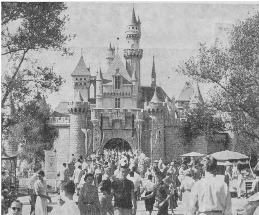
Disneyland – fantastiškas pasakų pasaulis vaikams.

Kaip šuo yra jautrus geram žmogaus žodžiui ir meilumui, nevienam šunų mylėtoju tenka įsitikinti. Labai dažnai užtenka tik vieno kito meilau kreipimosi, ir tuoj pradeda šuo tave sekti. Pradėjęs pradžioje loti, vėliau tą savo lojimą jau pakeičia uodegos vizginimu. O dar vėliau tasai "piktasis" šuo prisiartina, prašydamas paglostyti. Nedaug yra šunų, kurie būtų piktume užkietėję prieš švelnų kalbinimą. Kartą šias eilutes rašančiam teko pergyventi gąsdinantį įvykį. Anais laikais vasarodamas Palangoje ir visai pamiršęs, kad vakare buvo neleidžiama eiti į Tiškevičiaus parką, nes būdavo paleisti rūmų šunes, ėjau link Birutės kalno. Staiga iš rūmų kiemo išbėgo keliolika didelių šunų ir, apsupę iš visų pusių, ėmė loti, atrodo, rengdamiesi sudraskyti. Ramiai stovėdamas ir nesiblaškydamas, pradėjau švelniai ir priekaištingai tais pačiais raminančiais žodžiais kalbėti: "Šuneliai, mieli