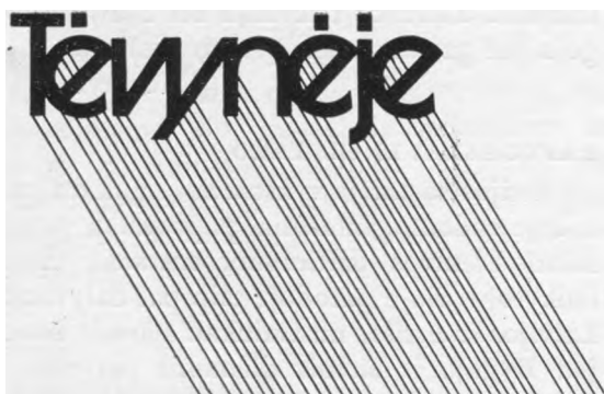
Paruošė DANUTĖ ir GEDIMINAS VAKARIAI