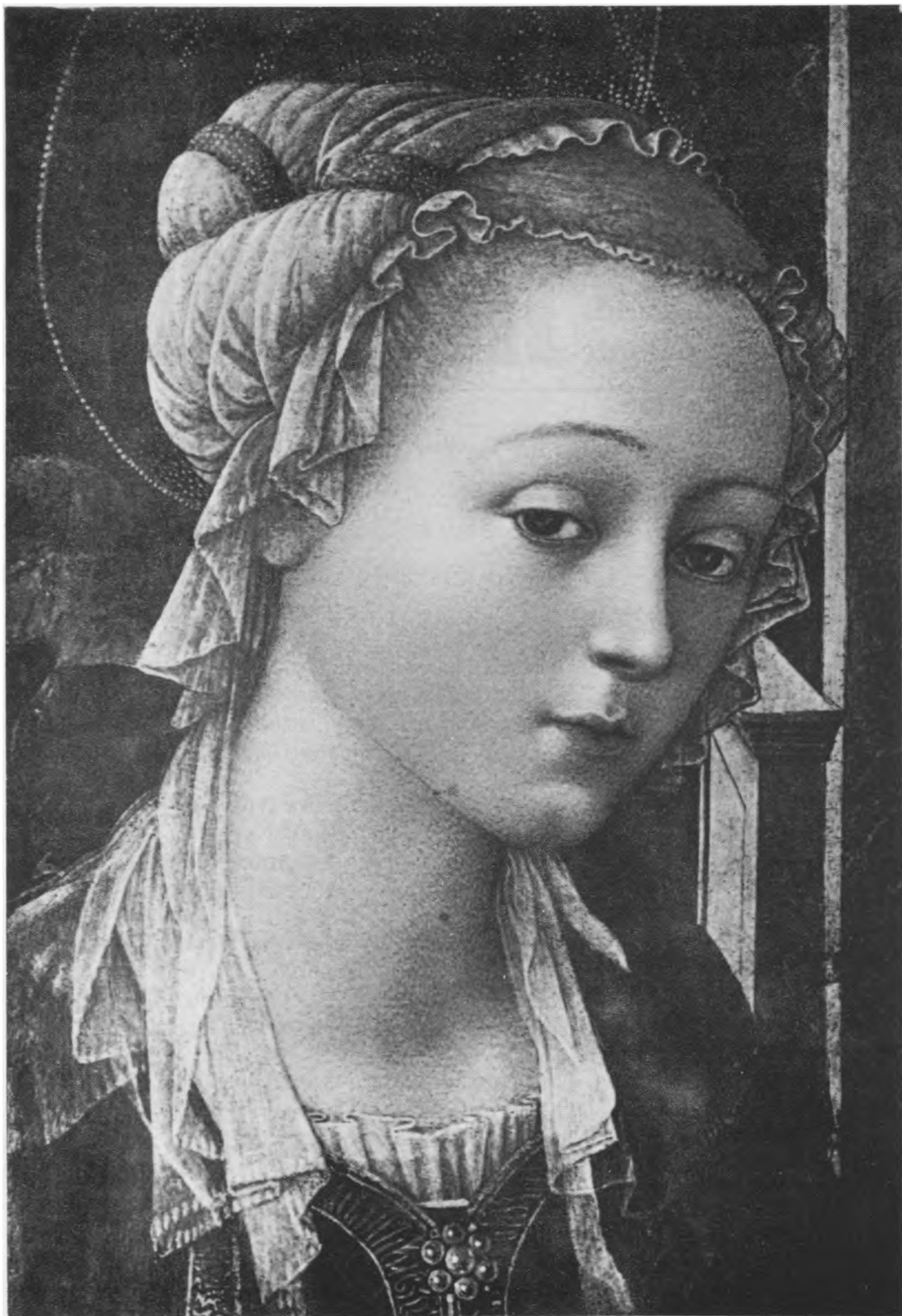
Švč. Mergelè Marija