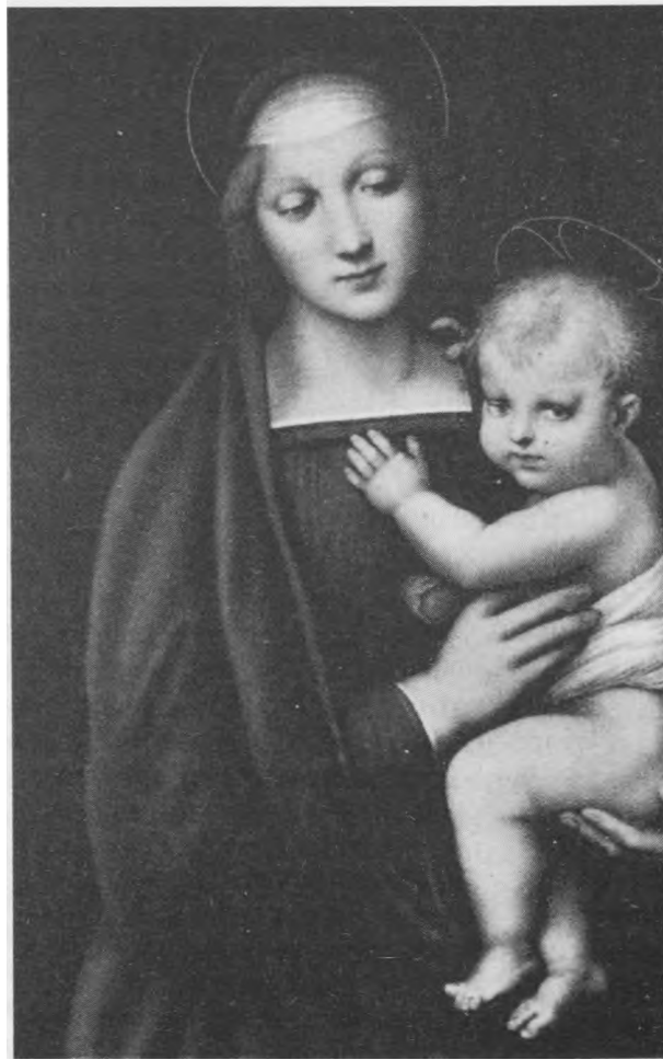
Marija su Kudikiu

Pavyzdžių turime ir dabar. Negimusių kūdikių žudymas yra plačiai paplitęs visame pasaulyje. Vien tik Amerikoje pernai sunaikinti 1,5 mil. negimusių kūdikių. Kad šis veiksmas atrodytų bent kiek “švaresnis” paprastai apie kūdikius net neužsimenama, vadinant mirtį pasmerktą žmogų motinos išsčiose gemalu (“fetus”) ar kuriuo kitu, primtinesnių vardu. Moterys, reikalaujančios, kad būtų visiškai legalizuoti abortai (ir viso krašto mokesčių mokėtojai padengtų jų išlaidas), nori turėti teisę “pasirinkti” nu-