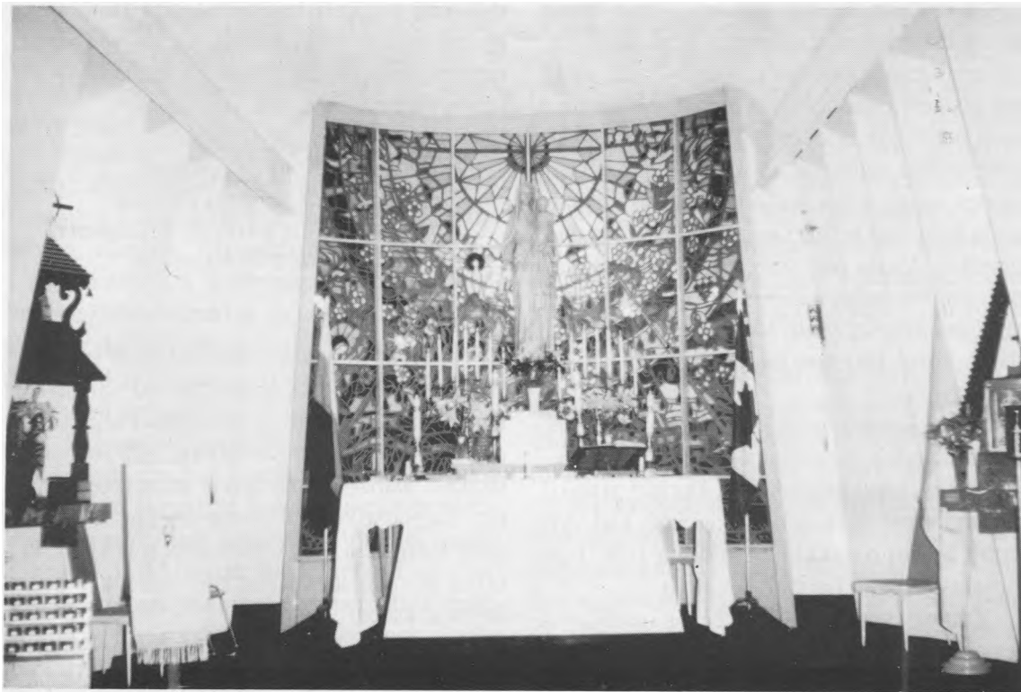
Londono Šiluvos Marijos bažnyčios didysis altorius.

sukamų girnų akmuo būtų užnertas jam ant kaklo ir kad jis būtų nuskandintas jūrų gilybėse” (Mat 18, 6). Turim saugoti savo mažylius nuo piktų žmonių, kurie gali sugadinti jų gyvenimą, pražudyti sielą. Taip ir Dievo mums įsakyta.