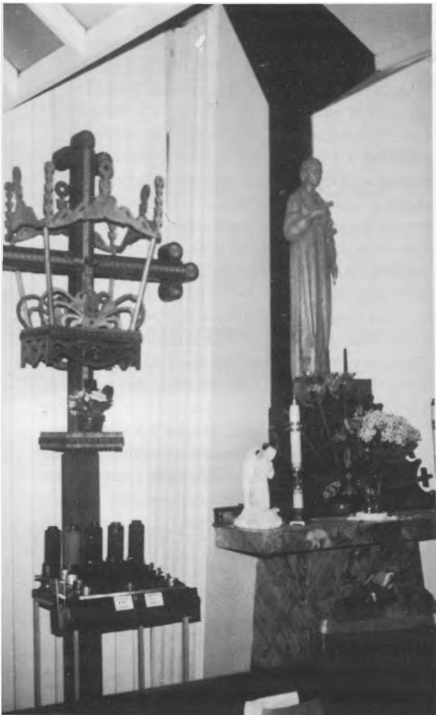
“Pakelės” kryžius su šv. Kazimiero koplytėle, dedikuota Lietuvos kankiniams.