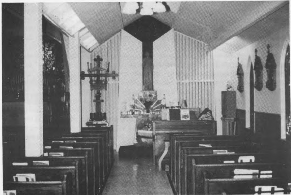
Šiluvos Marijos bažnyčios šoninė nava su šv. Kazimiero medžio drožinio statula.

2) To įvykio sudabartinimas sakramentuose, kuriuos švęsdamas žmogus pereina iš mirties dvelkimo į naują būtį — šitaip kiekvienas dalyvaujame Kristaus Prisikėlime, taip pat visa visata yra pastūmėta pereiti į naują žemę, apie kurią kalbama Apokalipsės knygoje.