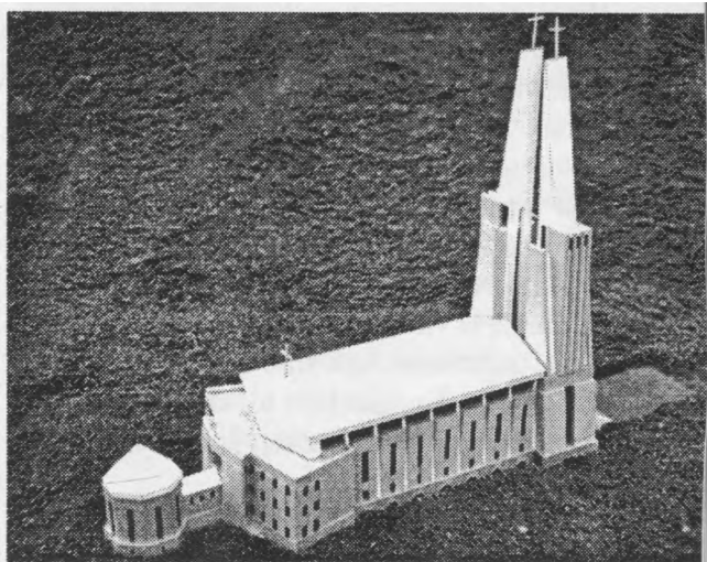
Klaipėdos Šv. Juozapo Darbininko bažnyčios maketas.

Mes laimingi! Mūsų atsinaujinimas, perkeitimas vyksta Kristuje. Ryškiausiai tai liudija Esmėkaita šv. Mišiose. Kviečių dulkės tampa Dievu... Ir mes Juo tampame diena iš dienos: