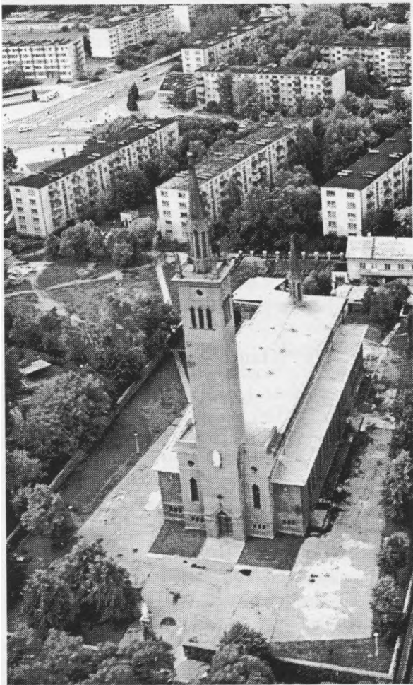
Marijos, Taikos Karalienės, bažnyčia, buvusi paversta filharmonija.