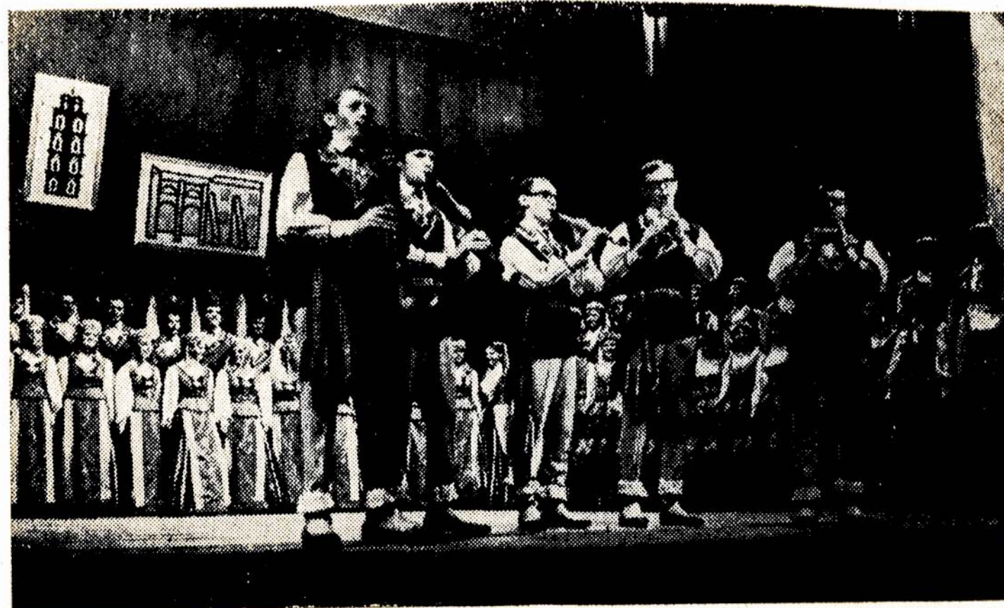
Nuotraukoje: stipriausių meno saviveiklos kolektyvų varžybos. Koncertuoja varžybų prizininkas — Vilniaus universiteto pavyzdinis dainų ir šokių liaudies ansamblis.

Daug idomiiu reginių vyko Vilniuje, pažymint Tarybų Lietuvos 30-metį.