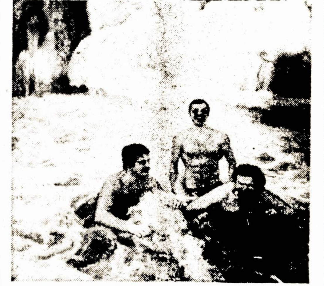
Žiemos sporto mėgėjai pamėgtoje maudyklėje prie Vilnelės užtvankos.