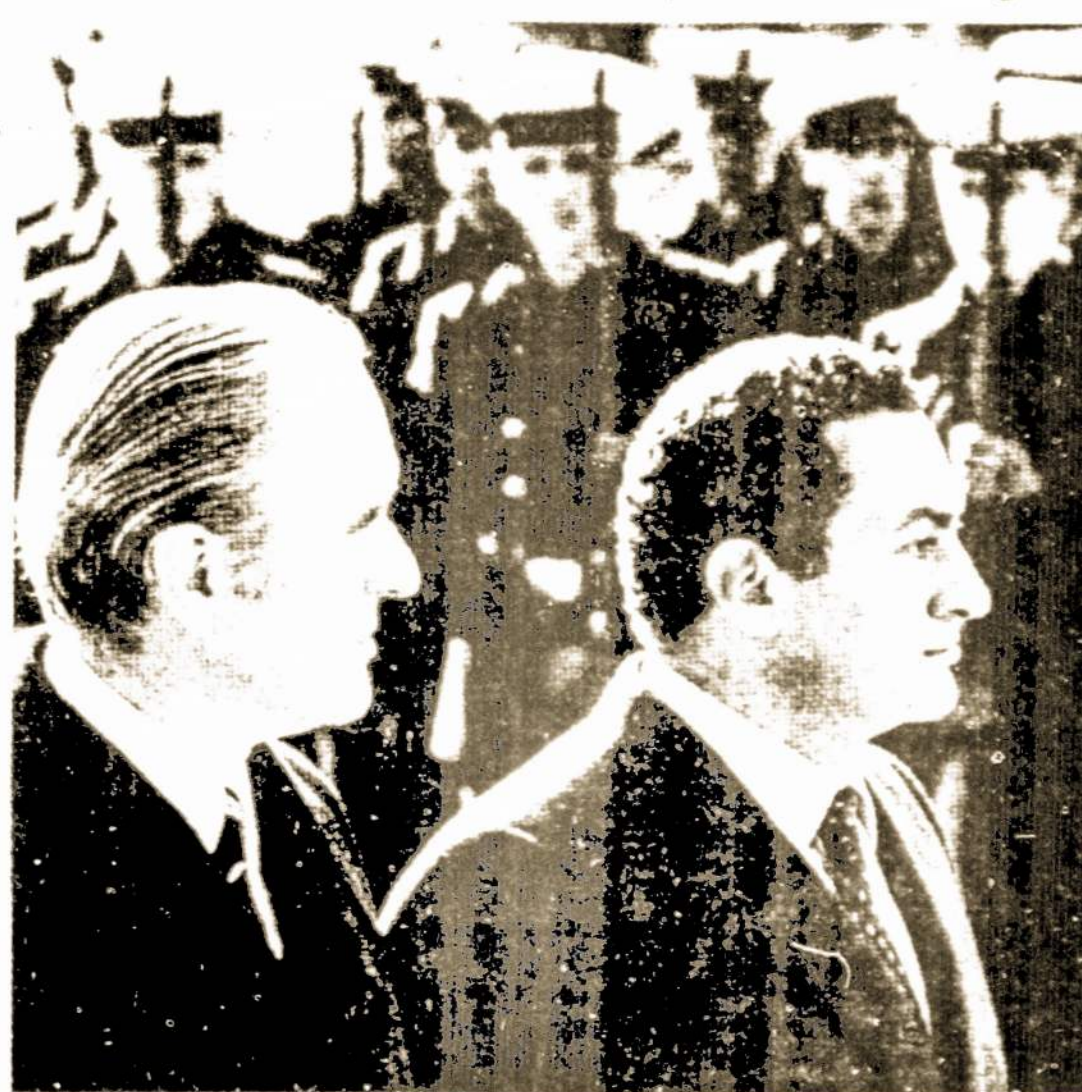
Egipto prez. Hosni Mubarak [d.] su Fed. Vokietijos prez. Karl Carstens Bonnos aerodrome priima karių garbės paradą.

Bonn. - Pirmojoje savo kelionėje į užsienius nuo to laiko, kai jis tapo Egipto prezidentu, prez. Sadatui tapus atentato auka, naujasis prez. Hosni Mubarak ne tik susipažįsta su padėtimi Europoje, bet ir siekia propaguoti taikos Artimuosiuose Rytuose reikalą. Tiek pima Britanijoje, tiek paskui Fed. Vokietijoje prez. Mubarak pabrėžia, kad Europos šalys gali turėti didelės įtakos taikai Artimuosiuose Rytuose.