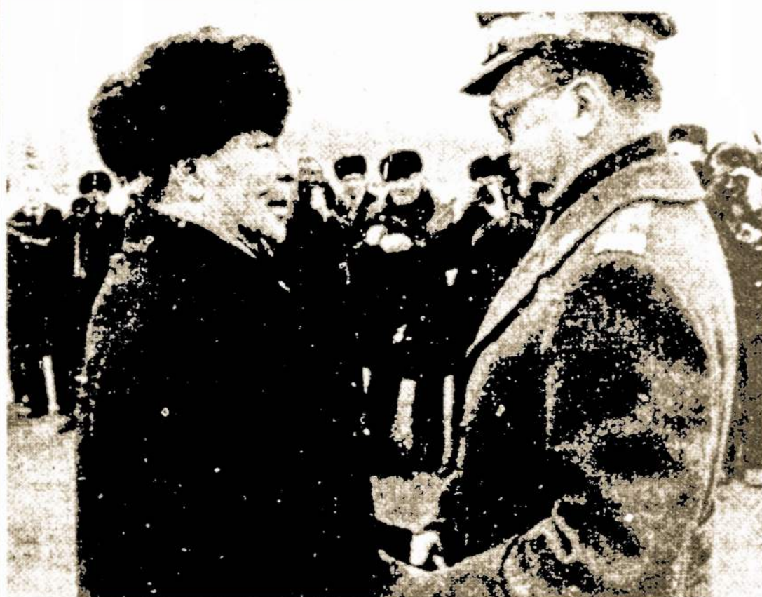
Dvi dienas Maskvoje viešėjo Lenkijos Tautinės Tarybos pirmininkas, lenkų komunistų partijos sekretorius ir premjeras gen. Wojciech Jaruzelski. Nuotraukoje—jį Maskvoje pasitinka Tarybų Sąjungos vadovas Leonidas I. Brežnevčas.

Lietuva. Atrodo, kad tai bus birželio mėnesio pradžioje. Ši ekskursija Lietuvoje viešės nuo birželio 7 iki 17-osios. Kaip greit bus viskas pa-ruošta, pranešime "Laisvė-je".