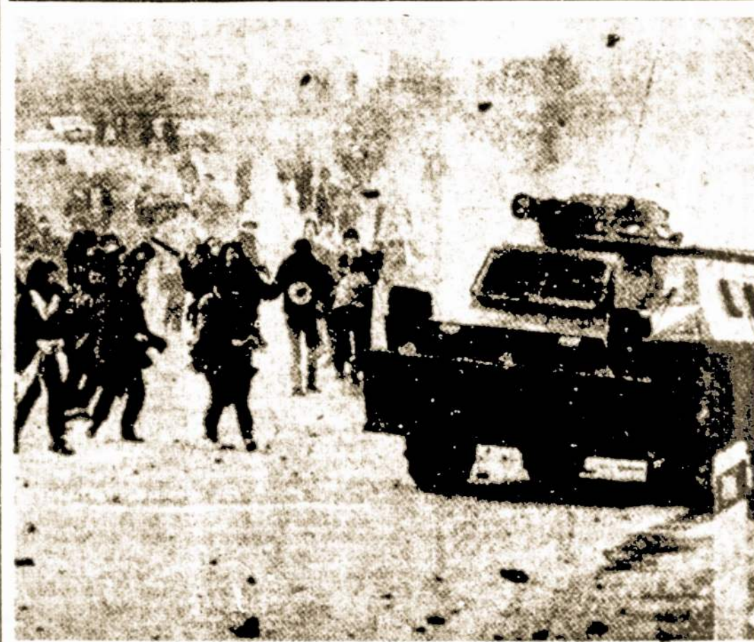
Pereitą šeštadienį netoli Chooz miesto, šiaurinėje Prancūzijoje įvyko masinė demonstracija prieš planuojama branduolinės jėgainės statybą. Kariuomenė su tankais buvo pašaukta riaušems malsinti.

Bulawayo, Zimbabve.—Zimbabvės premjeras Robert Mugabe pareiškė, kad Joshua Nkomo, kurį jis atleido iš ministrų kabineto, kaltindamas jį samokslu prieš vyriausybę, turės būti teisia-mas už konspiraciją pradėti civilinį karą.