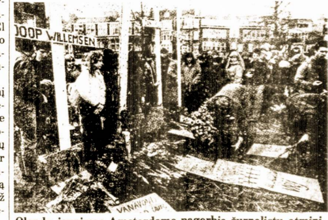
Olandų jaunimas Amsterdame pagerbia žurnalistų atminimą, padėdami gėlių aikštėje priešais JAV konsulatą.

Amsterdam. — Dideliu pasipiktinimu olandai sutiko žinias apie tai, kad Salvadore buvo nužudyti keturi jų TV žurnalistai.