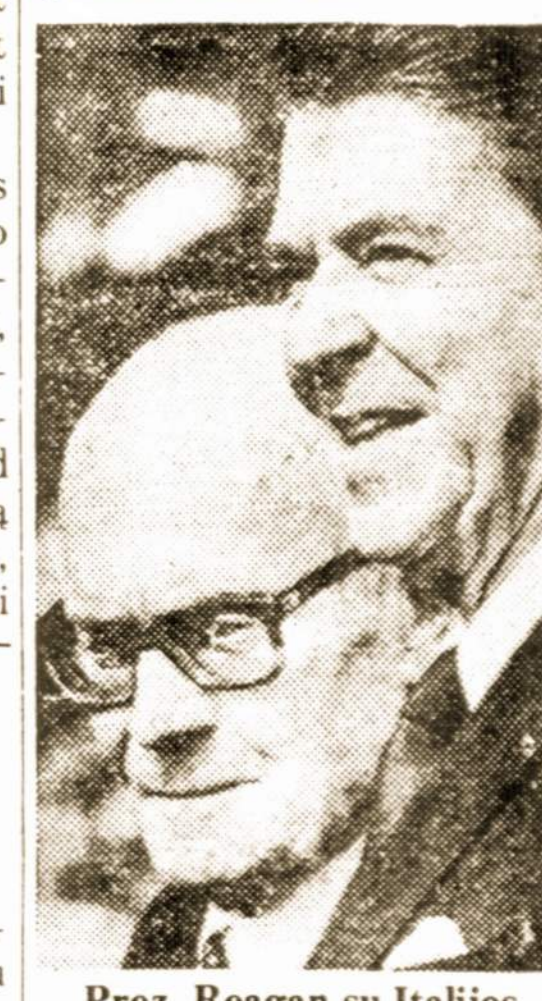
Prez. Reagan su Italijos prezidentu Pertini

Washington.—Nepaprastai šiltai prez. Reagan ir jo administracija priėmė Italijos prez. Sandro Pertini, atvykusį daugiau kaip savaitės vizitui į Ameriką.