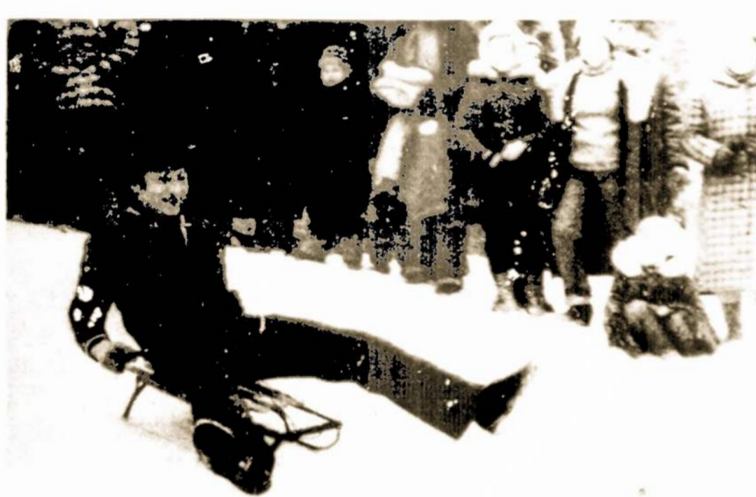
Iš žiemos šventės. Tėveli, laikykis!