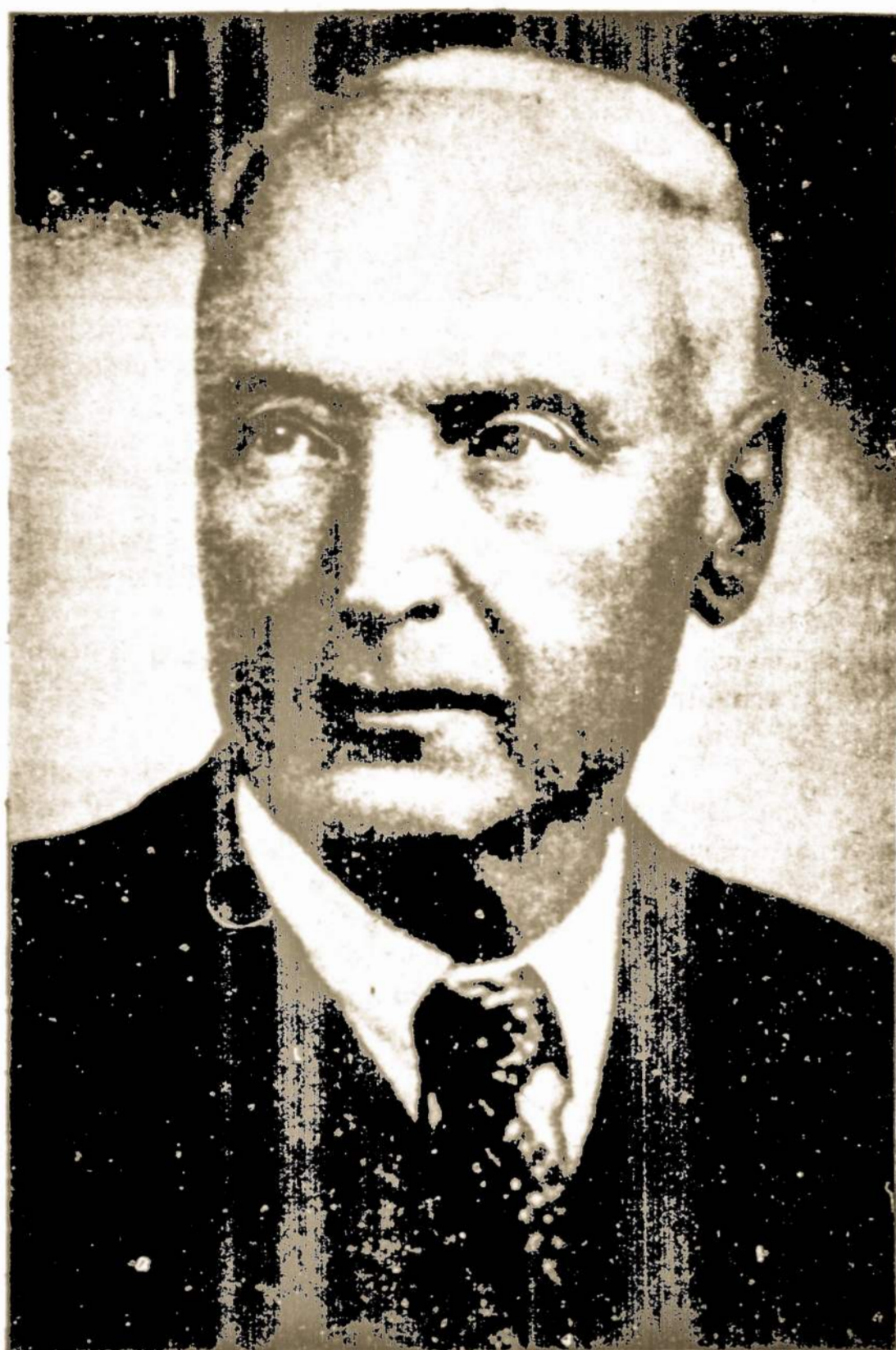
A. Vienuolis-Zukauskas (1882-1957)

[Minint Antano Vienuolio-Zukausko 100-ąsias gimimo metines]