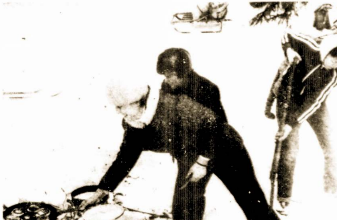
Iš žiemos šventės. Blynai—tai gardumynai visų lietuvių.