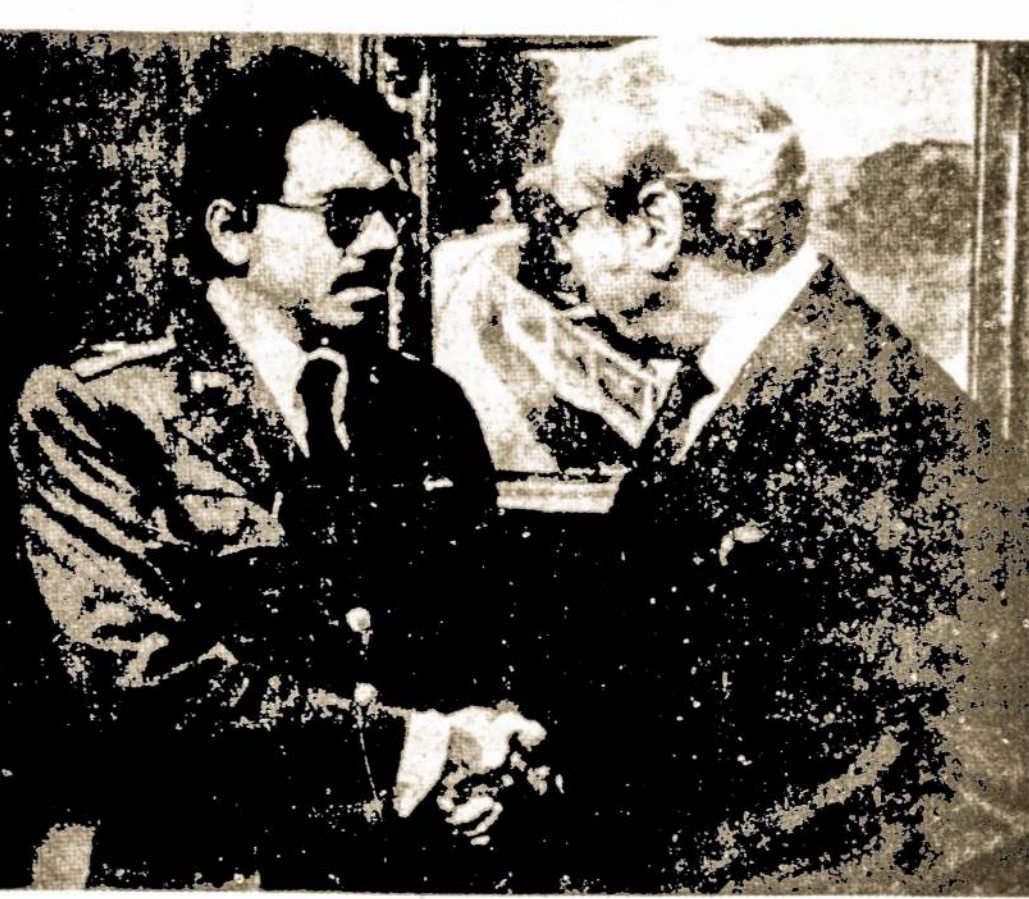
Nikaragvos revoliucinės vyriausybės vadas Daniel Ortega Saavedra, kairėje, kalbasi su Jungtinių Tautų gen. sekretorium Javier Perez de Cuellar.

Jungtinės Tautos.—Kovo 25 d. specialiai suauktame Saugumo Tarybos posėdyje Nikaragvos revoliucinės vyriausybės vadas Daniel Ortega Saavedra kvietė apsvastyti JAV planus surengti intervenciją prieš jo šalį ir tvirtino, jog Nikaragvos valdžia turi nenuginčijamą įrodymą, kad JAV teritorijoje formuojamas ir apmokamas saminčių iš Lotynų Amerikos šalių legionas ir planuojamas pamesti į Nikaragvą kovai prieš revoliucinę vyriausybę.