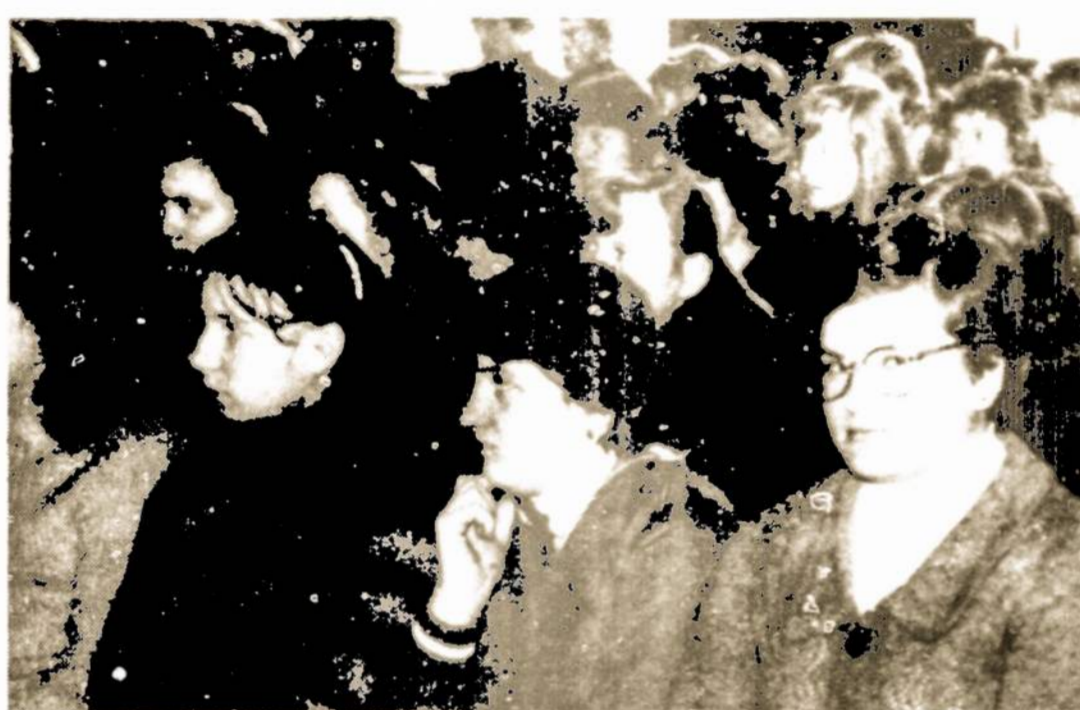
Iš konservatorijos dienu Kapsuke. Auditorijoje klausosi pranešėjų ir koncerto.