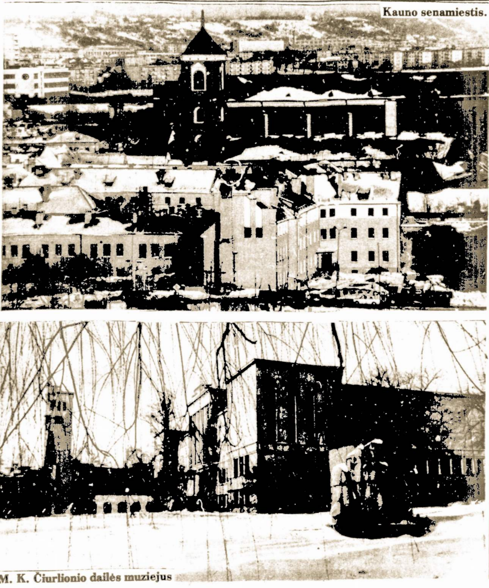
M. K. Ciurlionio dailės muziejus