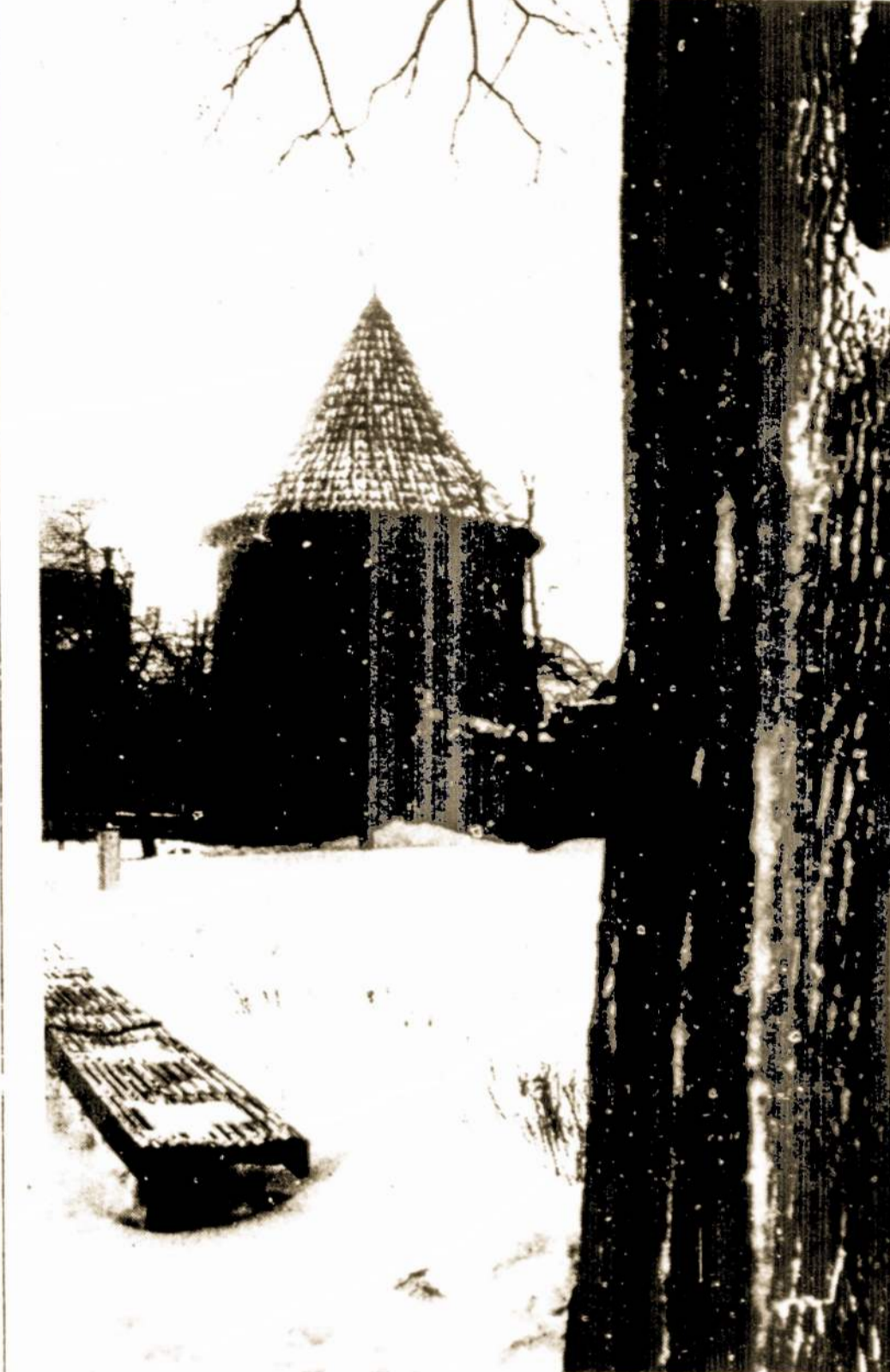
Kauno pilis.