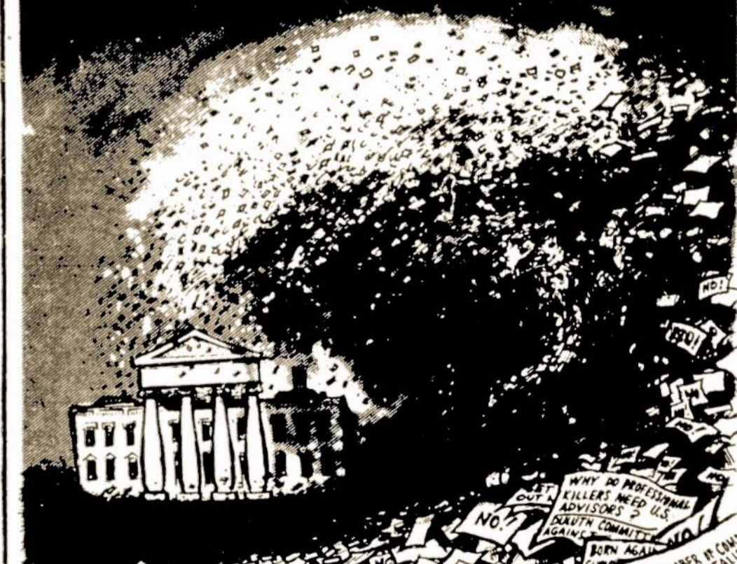
News item: In a moment of rare candor, President Reagan concedes that not all of the White House mail fully supports the Administration's position on El Salvador.

"Tai—tipiška "pagalba" amerikietiška. "Pagalba" tankais, automatiniais ginklais, kariniais patarėjais, kurių skaičius vis didėja ir kurie tiesiogiai kišasi į įvykius šalyje. Žurnalistai nesenai įrodė, kad patarėjai, skirtingai nuo oficialios versijos, turi automatinius ginklus.