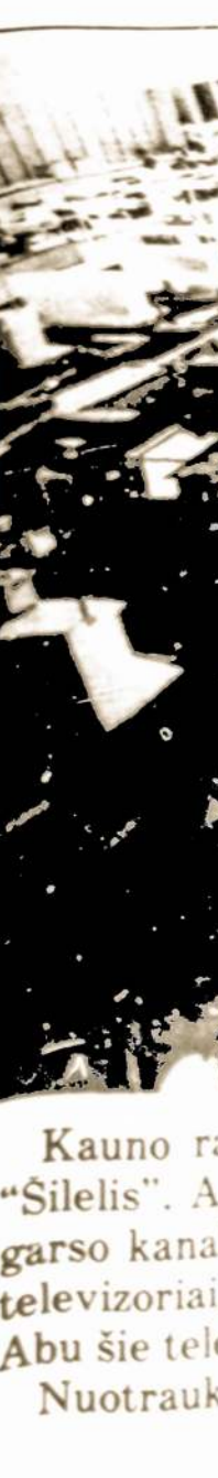
Kauno ra "Silelis". Ar garso kanal televizoriai. Abu šie tele Nuotrauko