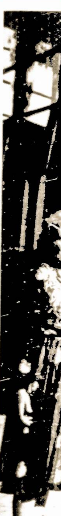
Grupė Ne Mildred Ste si Tarybu 70-metis.

Grupė m nizuotų "F coise de s mokyklų p biaušiu mo skrido į E tēm pavand sis Prane Sveicarijoj