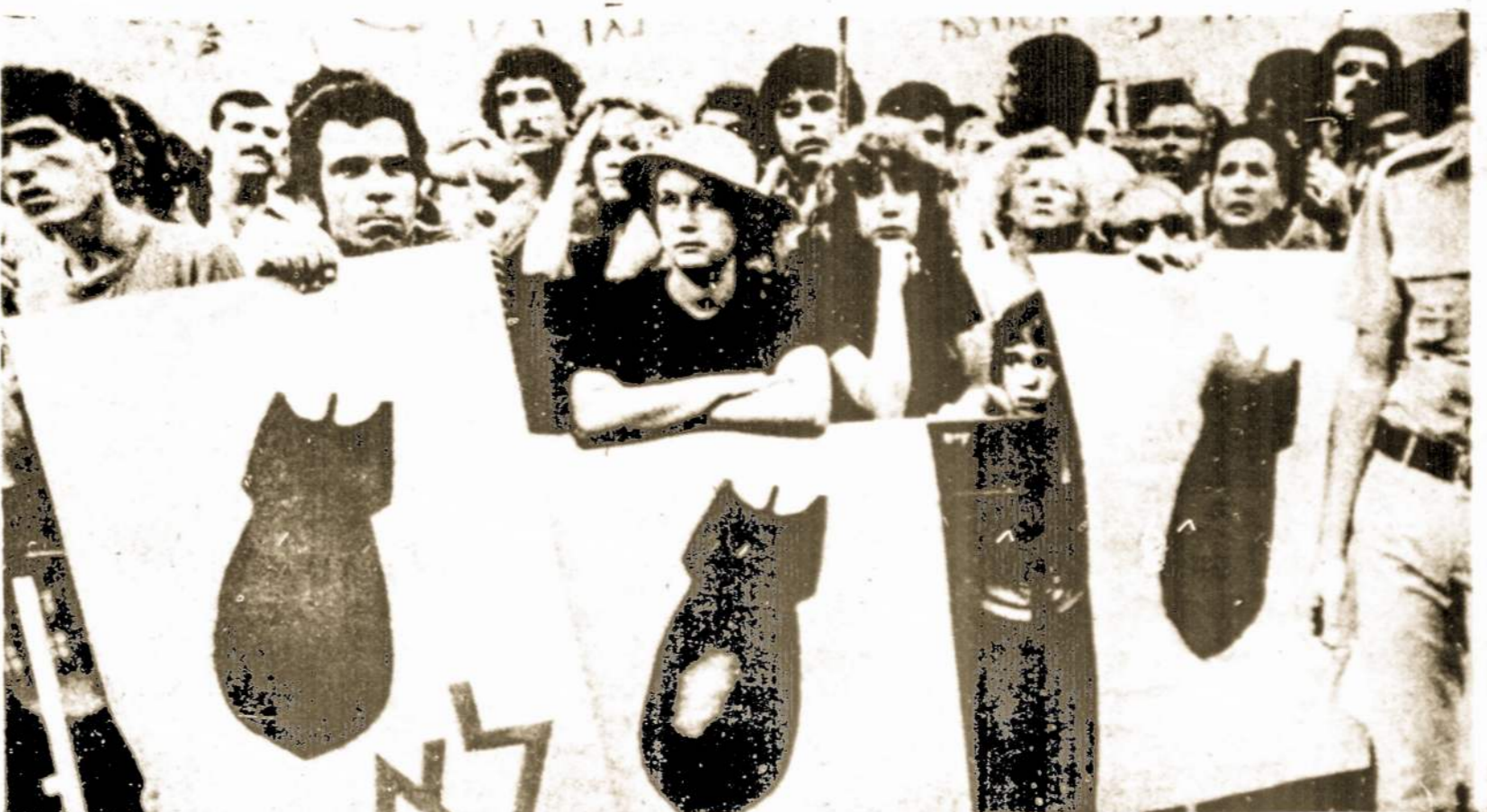
Ne tik visas pasaulis, bet ir daugelis paties Izraelio gyventojų ir karių protestuoja prieš Izraelio invaziją į Libaną ir prieš civilinių žmonių žudymą ir Beirutą deginimą ir griovimą. Nuotraukoje — protesto mitingas Tel Avive.

Amerika esanti tuo susirūpinusi, nes Irano kariuomenės pajudėjimas sudarytų jai problemų, kadangi jai draugiškos Saudi Arabija ir Kuwait vyriausybės bijo Irano revoliucinių idėjų.