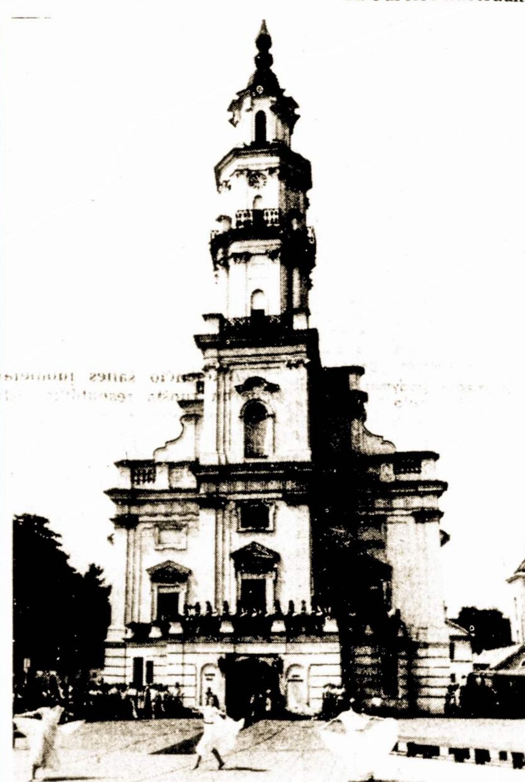
Nuotraukoje: Tradicinė šeimos švenčių vieta Kaune—Rotušės aikštė.

Tūkstančius kauniečių kviesliai sukvieta į Rotušės aikštę, kur įvyko tradicinė šeimos šventė.