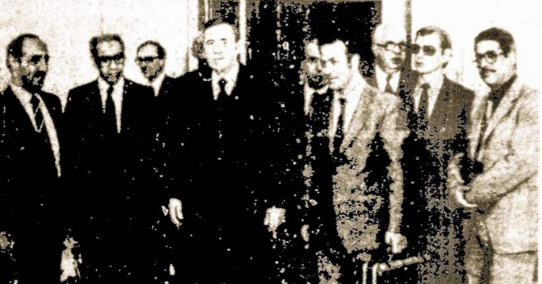
Tarybų Sąjungos užsienio reikalų ministras Andrejus Gromyka, viduryje, liepos pirmą savaitę buvo susitikęs su Arabų Valstybių Sąjungos atstovais, kurie buvo atvykę į Maskvą pasitarti dėl padėties Libane.

Sakoma, jog Vatikanas tam tanke turis tam tikrą dalį šėrų. Tasai Calfi Italijos valdžios buvo nubaustas už "nesklandumus", bet nesulaukė apeliacijos, nes 1981 m. birželio 18 d. jis buvo rastas