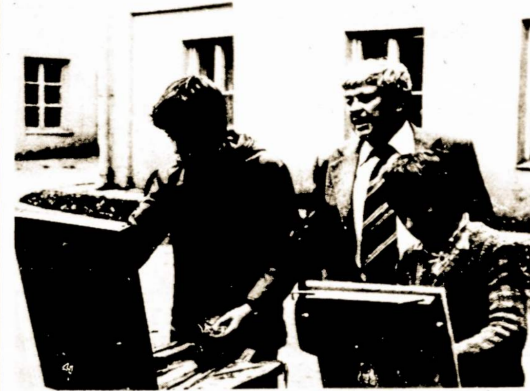
Daugiau kaip keturiasdešimtį metų pagrindinius vaidmenis atliko TSRS Liaudies artistas Donatas Banionis, Panevėžio dramos teatro vyriausiasis režisierius. Nuotraukoje: Donatas Banionis su jaunaisiais dailininkais.