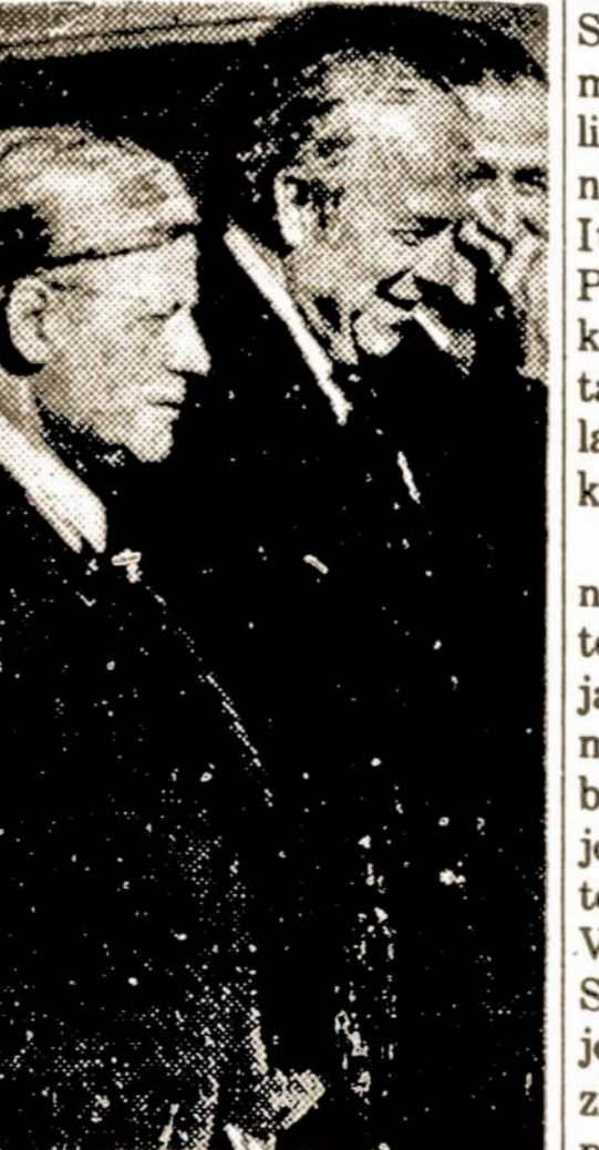
Fed. Vokietijos kancleris Helmut Schmidt su Valstybės sekretorium George Shultz.

Be to, Indira kelsianti klausimą ir dėl JAV uranių pristatymo atominiams reaktoriui, esančiam Tarapur vietovėje, kurį pagal 1963 m. susitarimą Amerika turi aprūpinti uraniu. Pastaruoju metu Amerikoje buvo kilę nuomoniu, jog po 1974 m. įvykdytų atominių bandymų Indijoje Amerika turėtų jai sustabdyti uranių tiekimą.