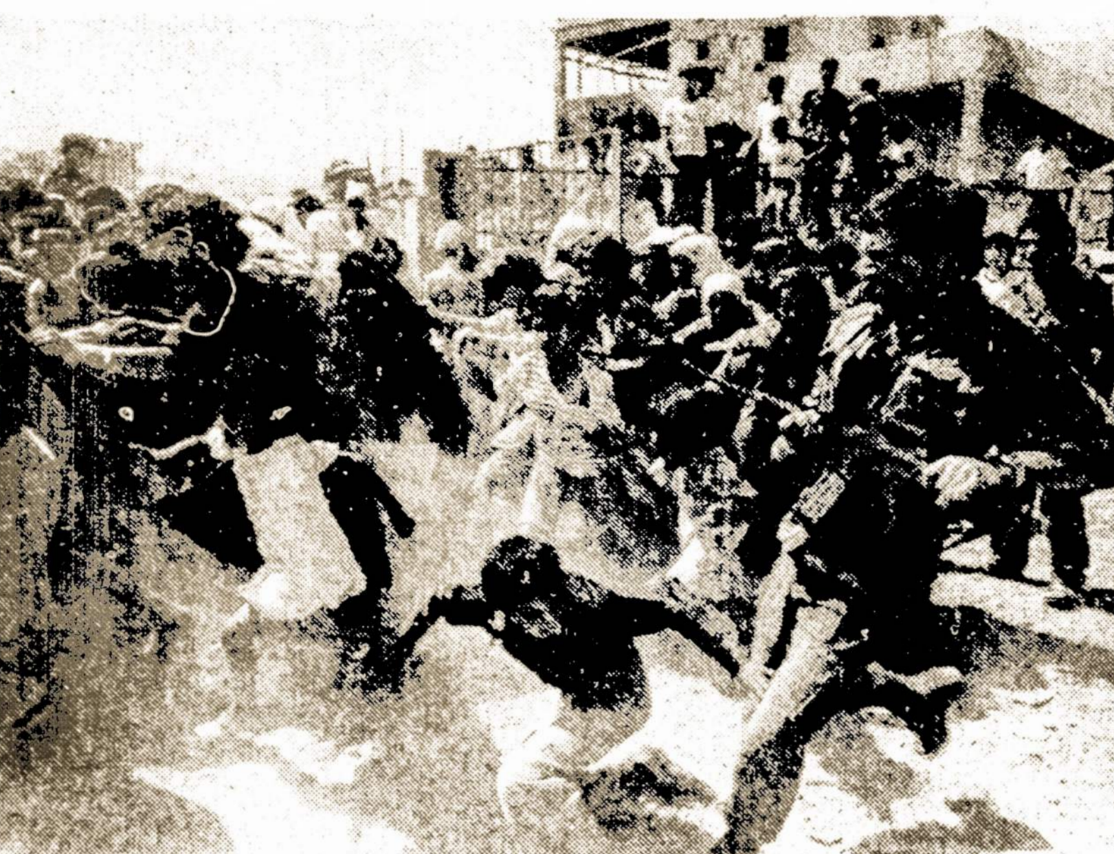
Izraelio kareiviai naudoja ginklus, naikindami vaikus ir moteris, kurie Sidon mieste, Libane, buvo atžygiavę reikalauti, kad būtų paleisti suimtieji jų giminės. Tuo tarpu vis dar tebevyksta pasitarimai tarptautiniu mastu dėl Palestinos Vadavimo Organizacijos kovotojų evakuacijos.