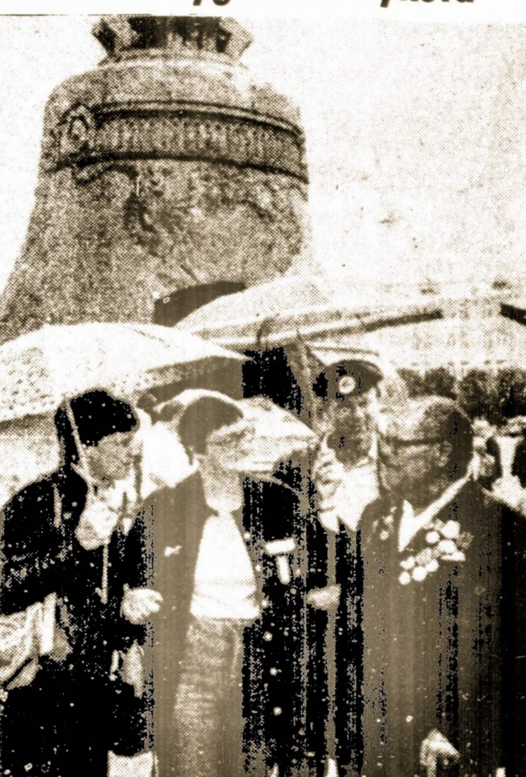
Pora skandinavų taikos žygiuotojų Maskvoje, Kremliaus rajone, kalbasi su tarybinio karo veteranu. Už jų didysis varpas, sveriantis 200 tonų, kuris buvo sugandintas 1737 m. gaisro metu, ir dabar esantis turistinė atrakcija.

Maskva. — Stockholme, Svedijoje, liepos 13 d. prasidėjęs taikos žygis šiuo metu yra pakeliui į Minską. Baltarusijos respublikos sostinė, kurią pasieks liepos 29 d. to žygio dalyviai, kurių daugiausia moterys, pasiekė Tarybų Sąjungą Leningrade, kur taikos traukinys atvyko iš Helsinkio.