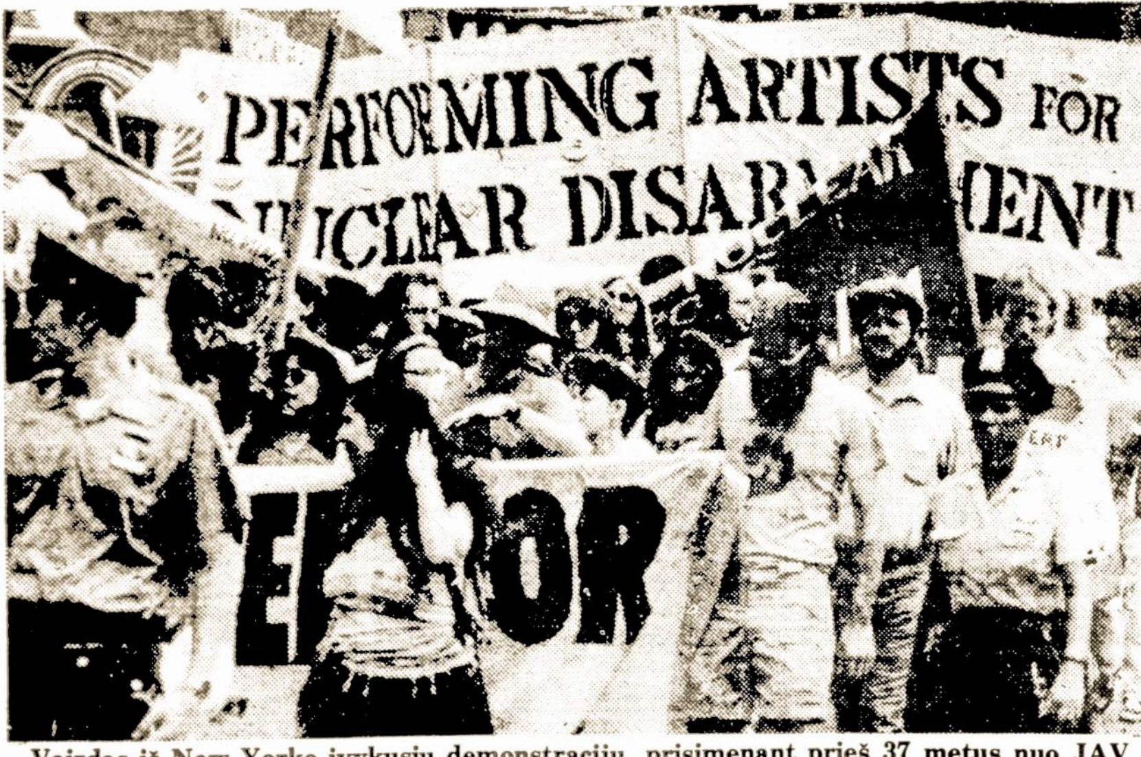
Vaidas iš New Yorke įvykių demonstracijų, prisimenant prieš 37 metus nuo JAV atominių bombų žuvusius Hirošimos ir Nagasaki gyventojus.