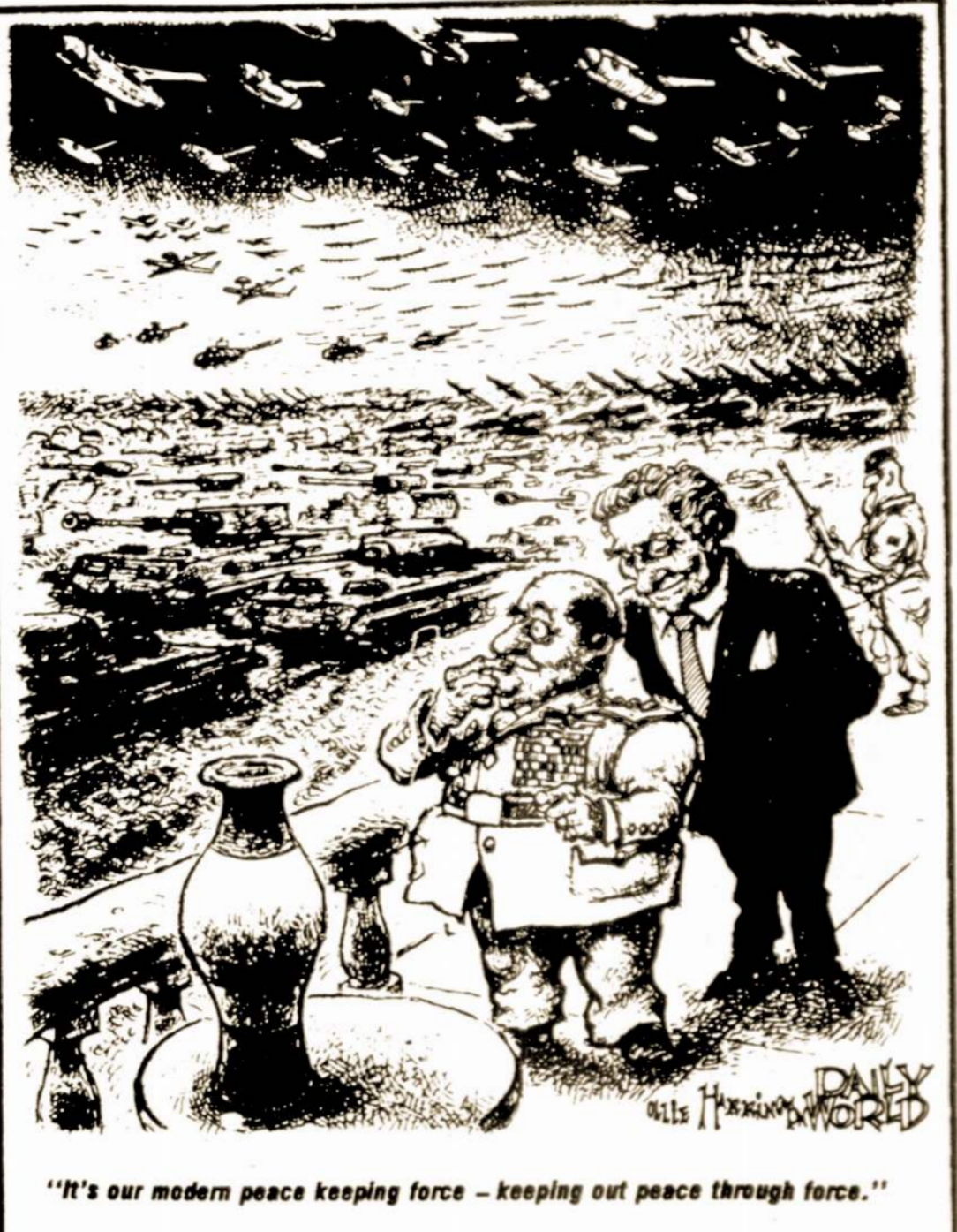
"It's our modern peace keeping force - keeping out peace through force."