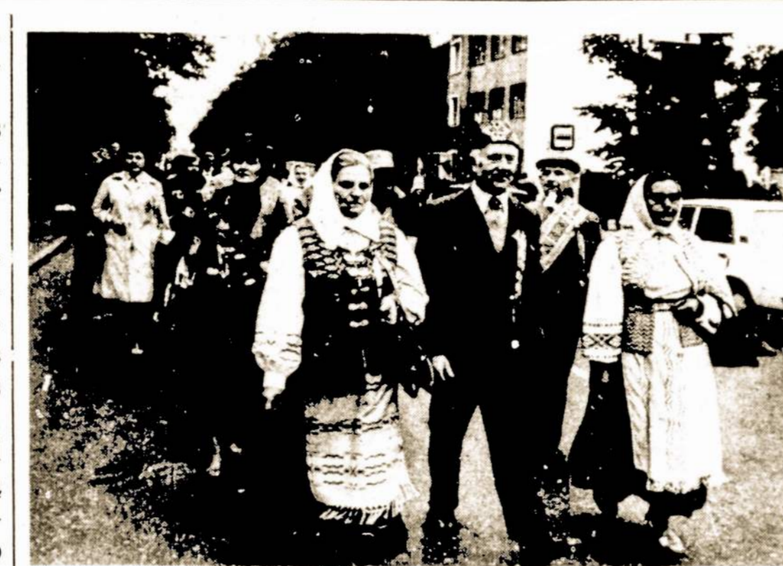
Liaudies menininkai šventinėje eisenoje.

Šiaulių K. Poželos kultūros ir poilsio parke įvyko rudens šventė-mugė. Šis šiauliėčių pamėgtas renginys sukvietė ir jaunus ir senus. Savo gaminius pirkėjams siūlė miesto imonės, sodininkai, bitininkai. Mugė praėjo gėlininkų išaugintais žiedais. Savo sugebėjimus rodė nagingi liaudies meno meistrai—puodžiai, audėjos, mezgėjos, kalviai, šaukštų drožėjai. Grojo kapelos, orkestrai.