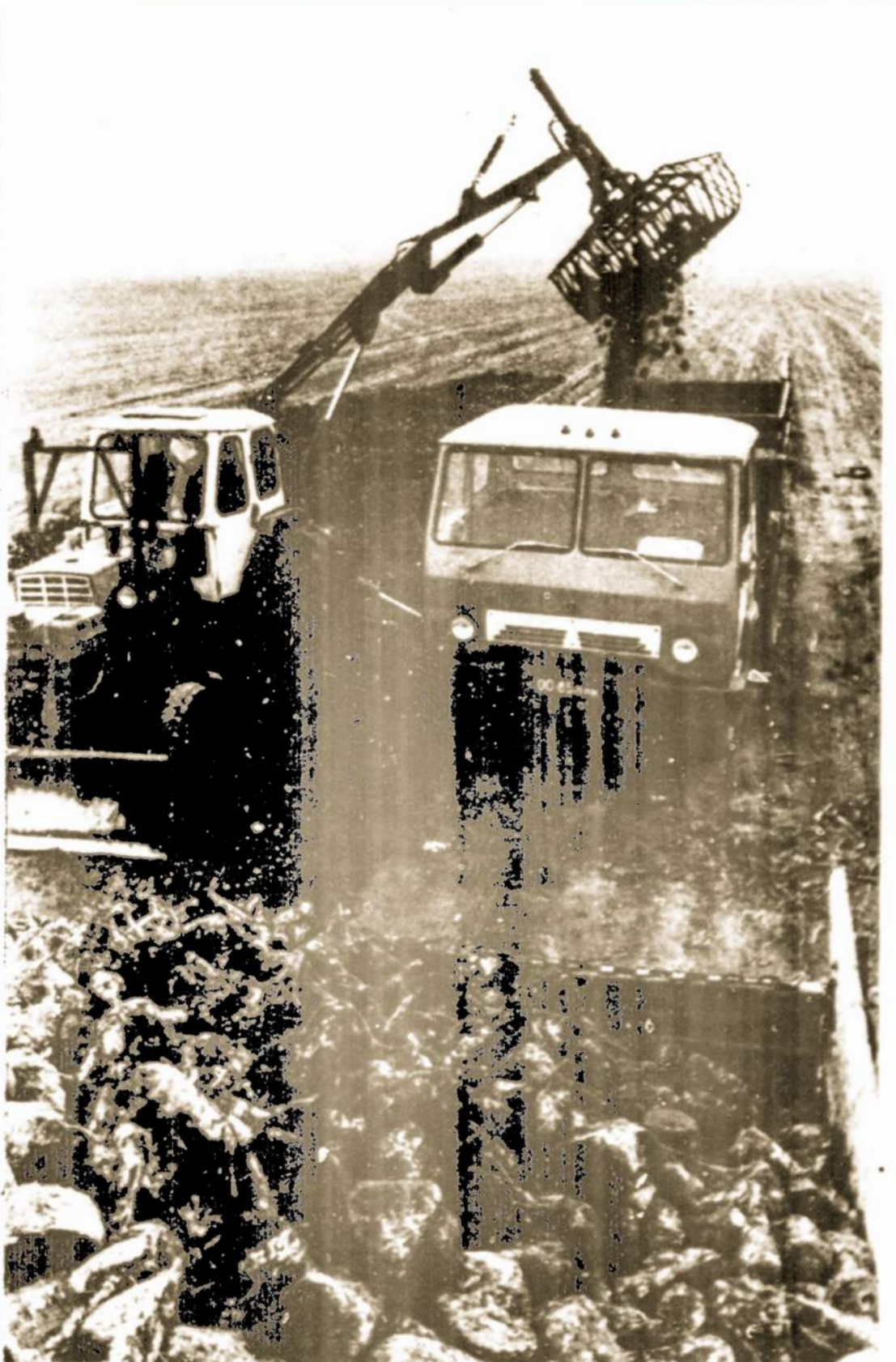
Siaulių rajono "Pirmyn" kolūkyje cukrinius runkelius kasė dviem kombainais. Kasdien buvo nukasama dvidešimt hektarų. Nuotraukoje: Iš laukų runkeliai keliauja į Paventų cukraus kombinatą.