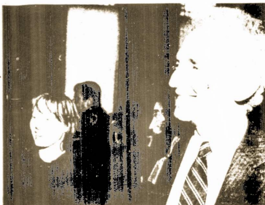
Amy Carter [left] and Daniel Ellsberg bet in a Northampton, Mass., courtroom at the trial for Miss Carter and 13 others. Mr. Ellsberg testified for the defendants, whose arrests stemmed from a 1986 protest against CIA recruiting at the University of Massachusetts.