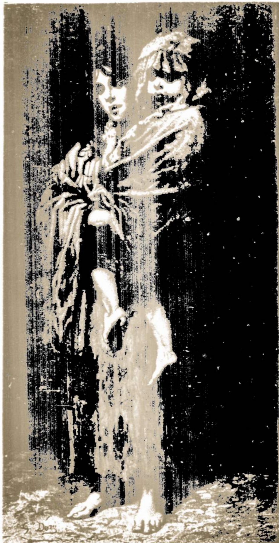
There are housing shortages of "severe proportions" for low-income renters and the homeless in more than half of 444 cities surveyed by the National League of Cities.

WHY do ALL OF YOU insist & demand that our blessed America — home of the free & land of the brave — remain 100 years BEHIND the "civilized" nations of the world?"