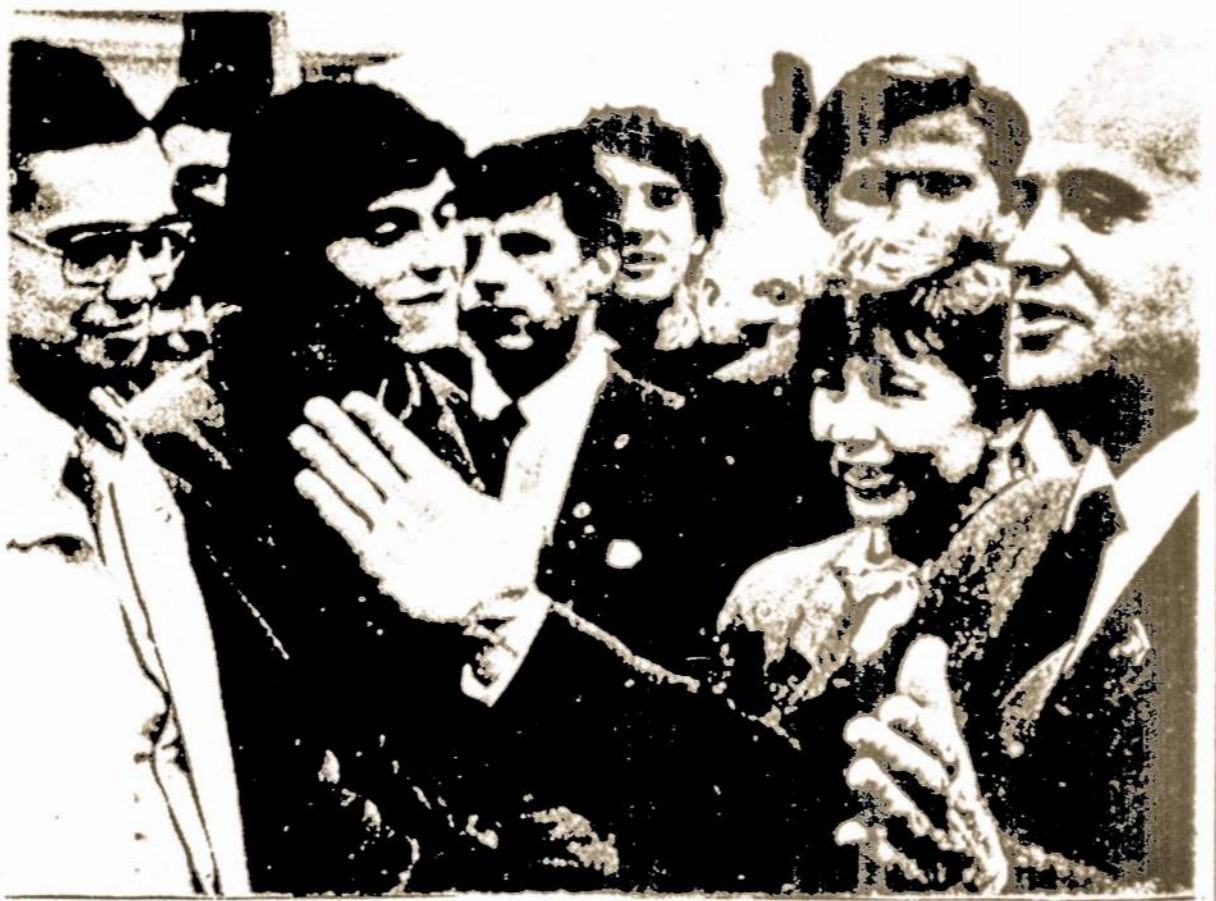
Tarybų Sąjungos vadovas Michail Gorbačiovas vieno susitikimo metu su studentais Bukareste. Su Rumunijos jaunimu jis diskutavo ir jiems aiškino naujusius persitvarkymus Tarybų Sąjungoje.

Bukarestas. — Tris dienas čia praleido Tarybų Sąjungos vadovas Michail Gorbačiovas ir su Rumunijos vadovu Nicolae Ceausescu išdiskutavo aktualiuosius uždavinius klausimus.