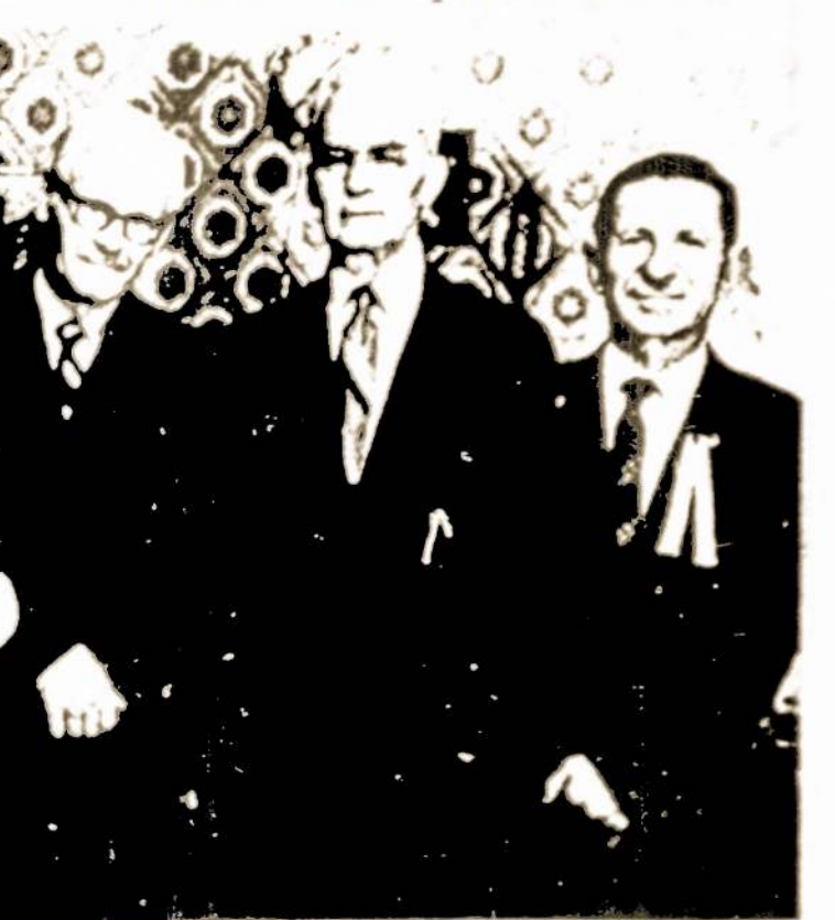
JUOZAS URBANAVICIAUS 80-MECIUI