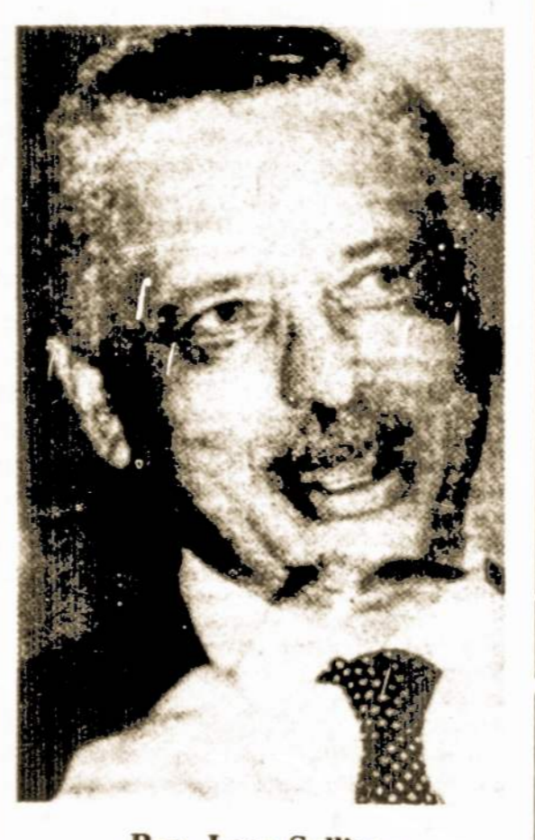
Rev. Leon Sullivan

Pietų Afrika bendradarbiaujančių bendrovių gaminių boikotavimas. Be to, kaip rasinės diskriminacijos oponentai skelbia, dabar Amerikoje didėja skaičius institucijų, kurios atsiima savo investavimus iš Pietų Afrikos. Jų tarpe jau yra penkis valstijos, devyni miestai ir 59 universitetai, kurie buvo investavę savo pensijų fondus imonėms, darančioms biznį su Pietų Afrika.