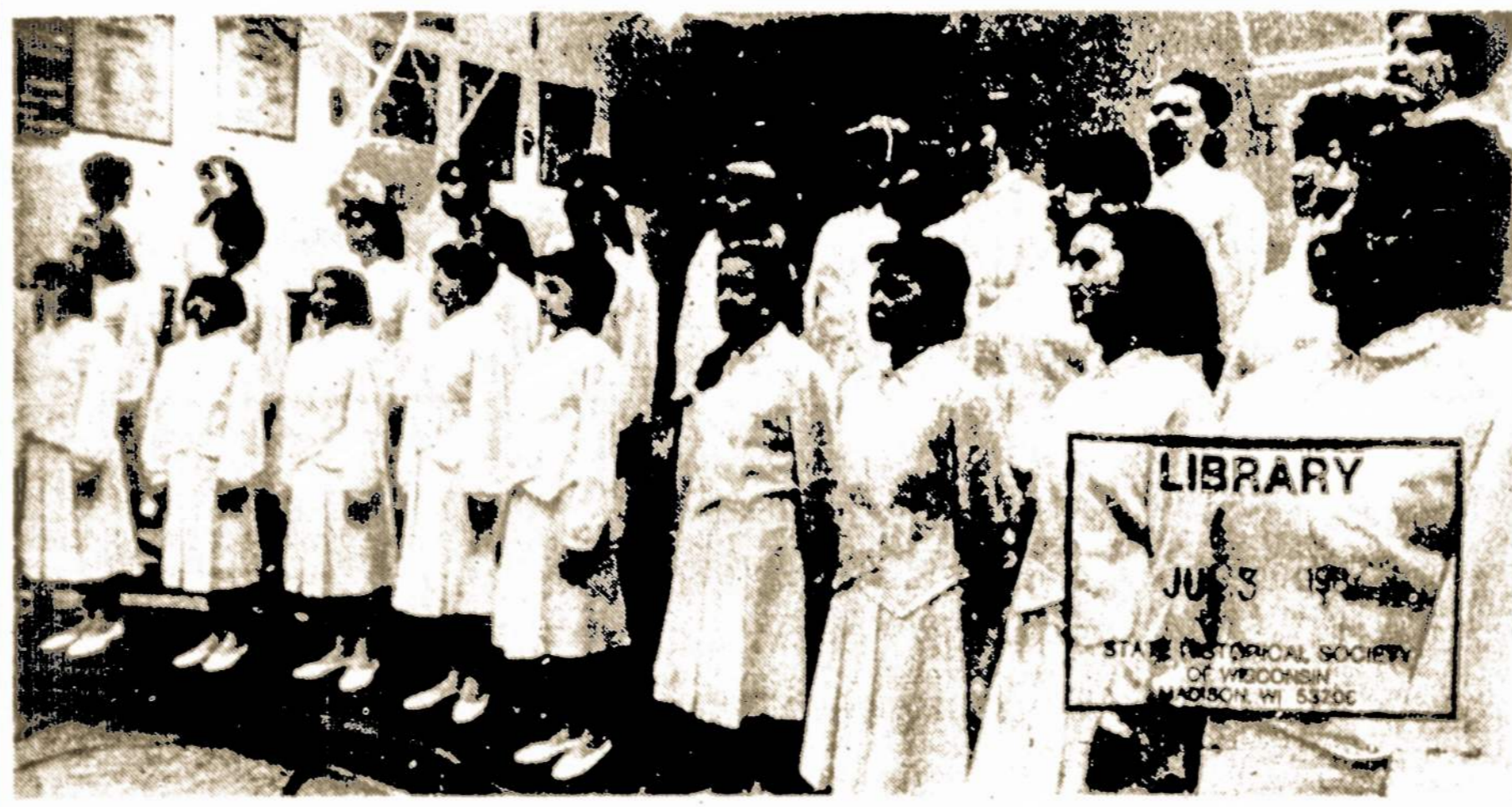
Dalis Leningrado moksleivių choro koncerto metu, amerikiečių šeimų, susipažino su vietiniu jaunimu ir Choristai buvo apgyvendinti pas dešimtį vietos su juo pabendravo.

New York. — Birželio pradžioje čia atvyko 33 tarybiniai moksleiviai iš Leningrado jaunimo choro aštuonių dienų viešnagei Amerikoje. Susipažinę su New Yorku, jie lankė Vermont valstijoje, kur Duxbury Harwood Union High School salėje jie turėjo koncertą ir susipažino su vietos moksleiviais, jų mokslo sąlygomis bei pabuvojo pas vietinius amerikiečius, porai dienų jų namuose. Prieš sugrįždami į Tarybų Sąjungą, jie susipažino su šalies sostinės Washingtono išmokybėmis.