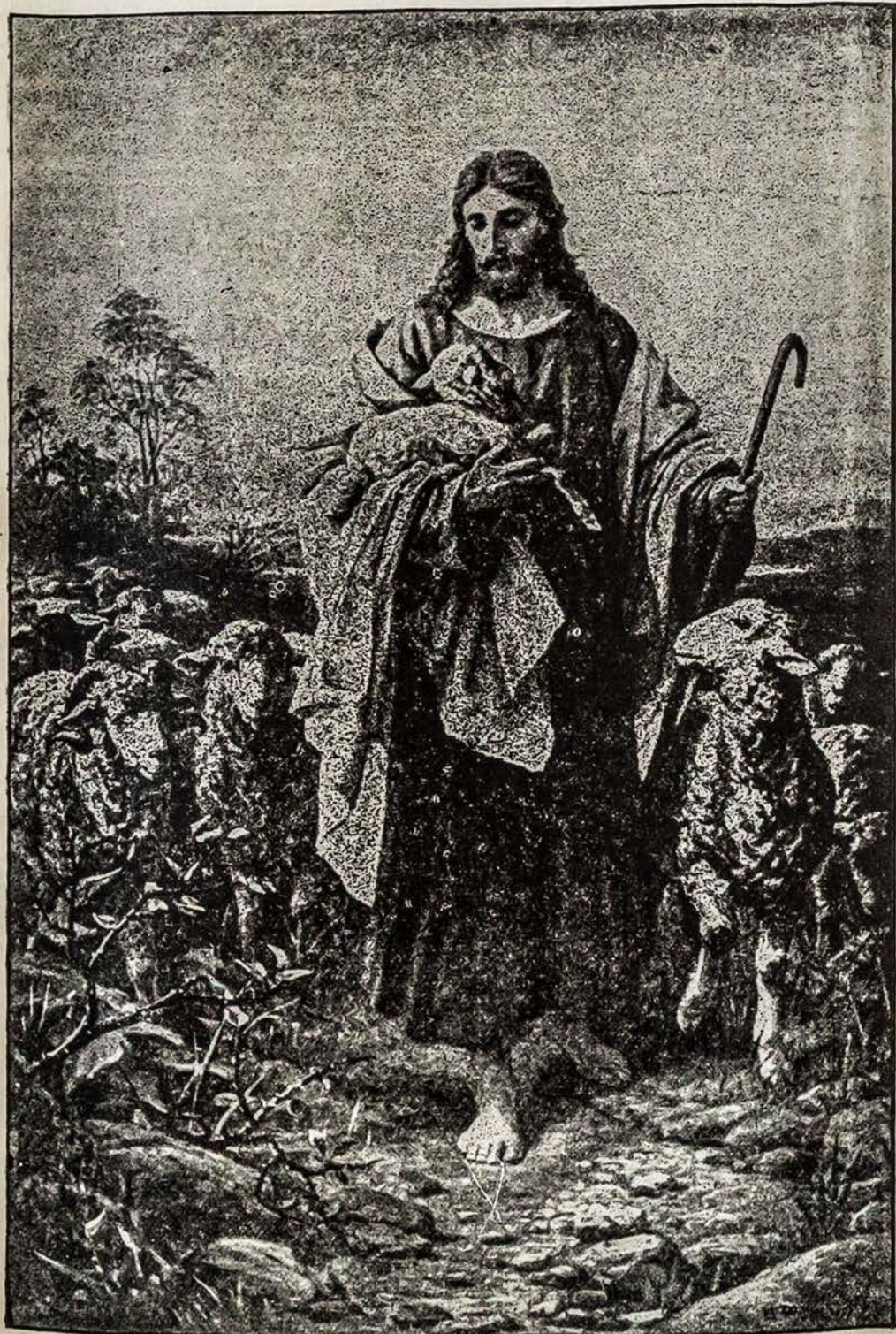
Jėzus — Gailestingasis Ganytojas.