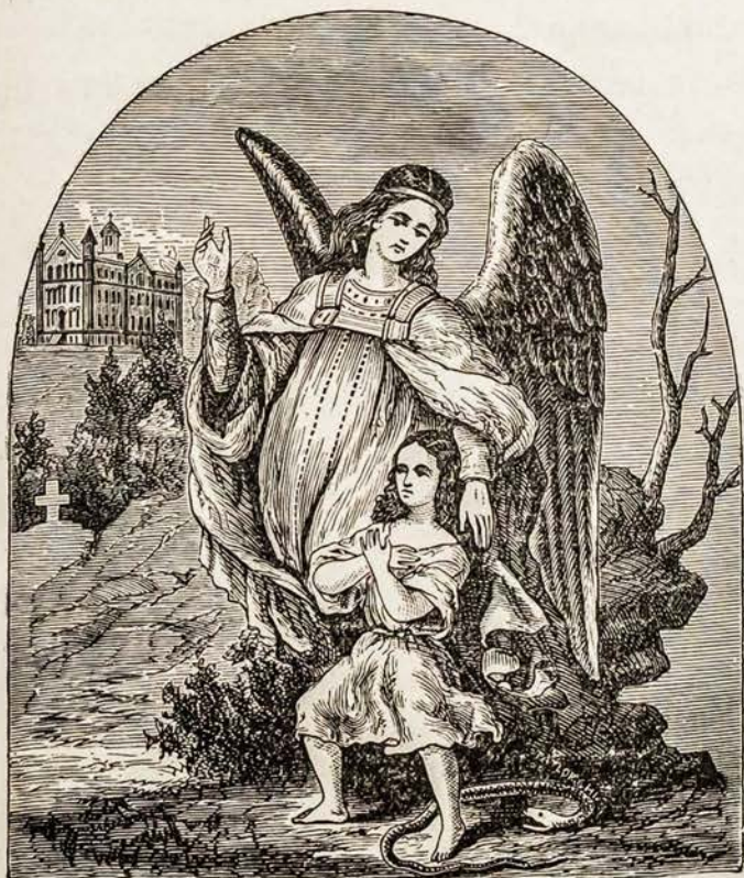
Geriausias Vaikučių Prietelis.