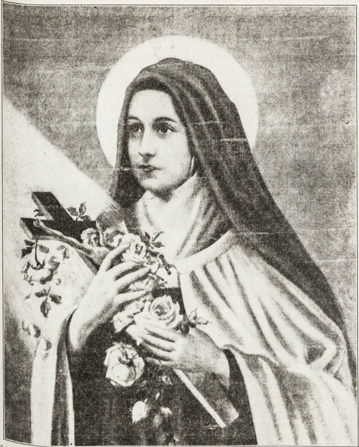
Šv. Teresė, "Jėzaus Mažoji Gėlėlė". Neužilgo išspaudos apie jos gyvenimą knyga su pridėtomis maldomis. Šv. Teresė yra plačiai pagars. teikiamomis žmonėms malonėmis.