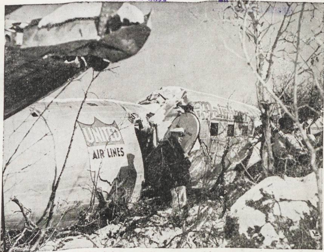
Utah valstijbēs kalnuosē nukrito keleivinis lēktuvas, su kuriuo 10 asmenu žuvo. Čia matome sudužusį lēktuvā.